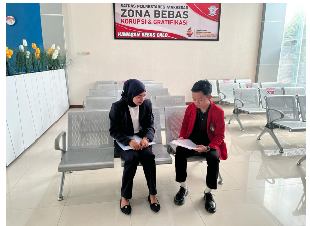
Wawancara dan foto bersama pemohon penerbitan Surat Izin Mengemudi