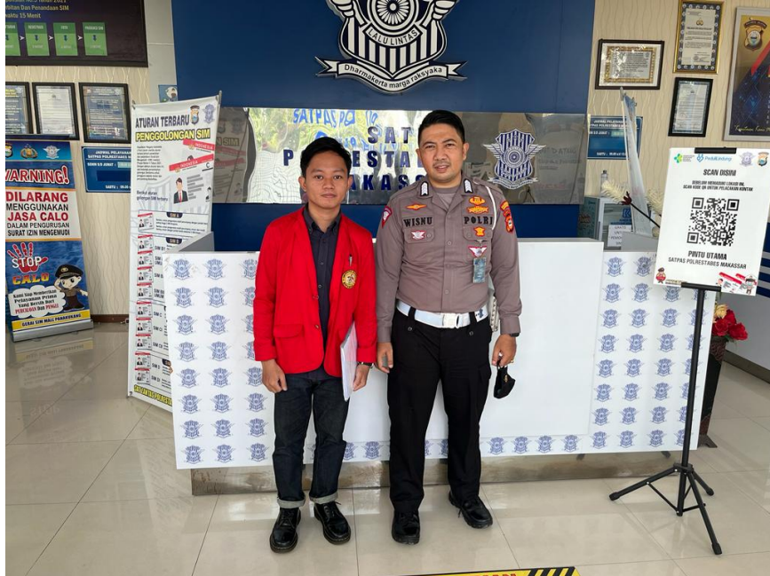
Wawancara dan foto bersama Brigadir Polisi bagian Benma