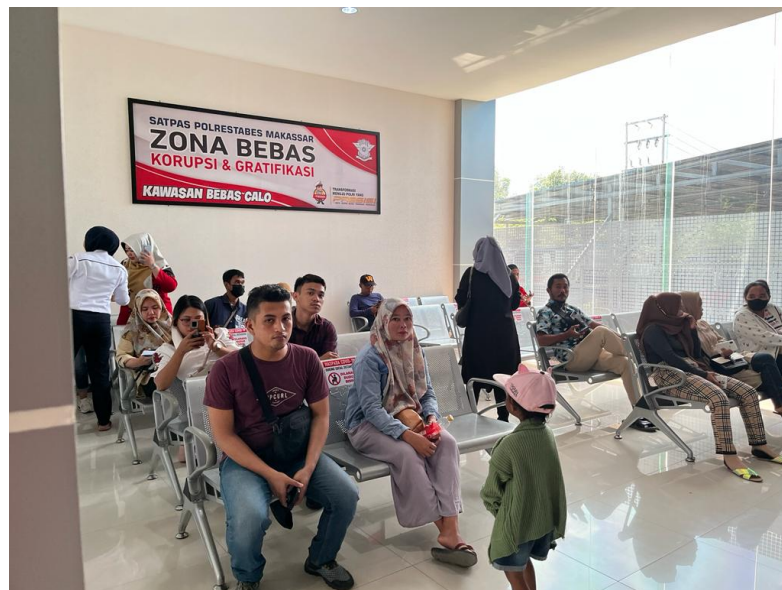
Foto ruang tunggu pelayanan loket Registrasi dan Identifikasi