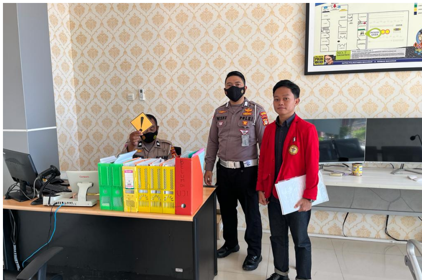
Wawancara dan foto bersama petugas loket tes rambu lalu lintas