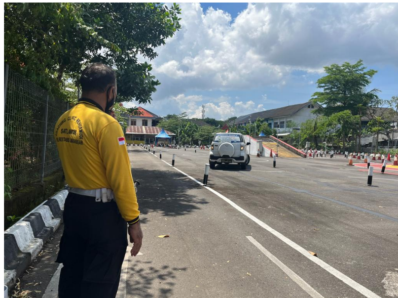
Foto Ujian Praktek SIM A