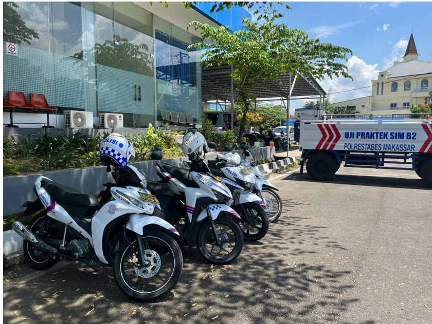
Foto Kendaraan Ujian Praktek