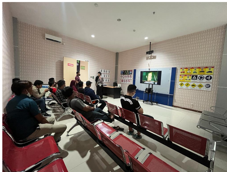
Foto ruangan pencerahan dan uji teori