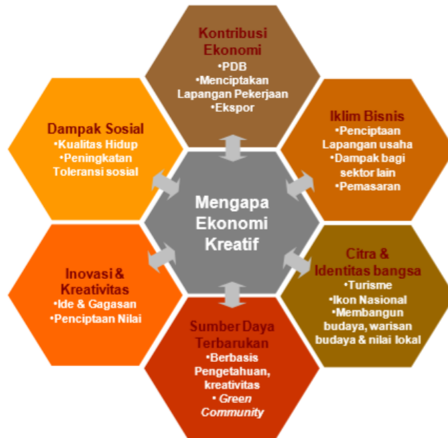
Gambar 2.1 Mengapa Ekonomi Kreatif Perlu dikembangkan? (Departemen Perdagangan RI)