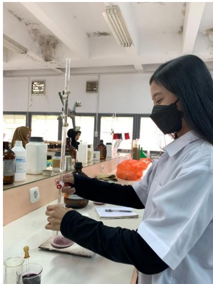
Analisis KTK dan basa-basa tukar Gambar lampiran 10. Dokumentasi laboratorium