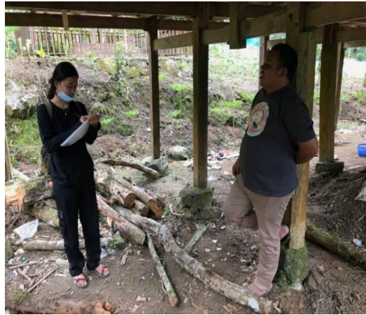
Pengamatan profil tanah dan wawancara petani Gambar lampiran 9. Dokumentasi lapangan