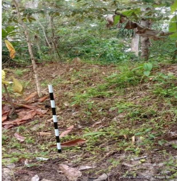
Gambar 5.1 Tampak Benteng Bagian Utara Tampak dari Luar