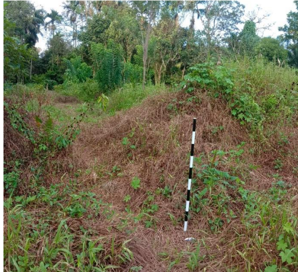
Gambar 5.3 Tampak Benteng Bagian Utara Tampak dari Dalam