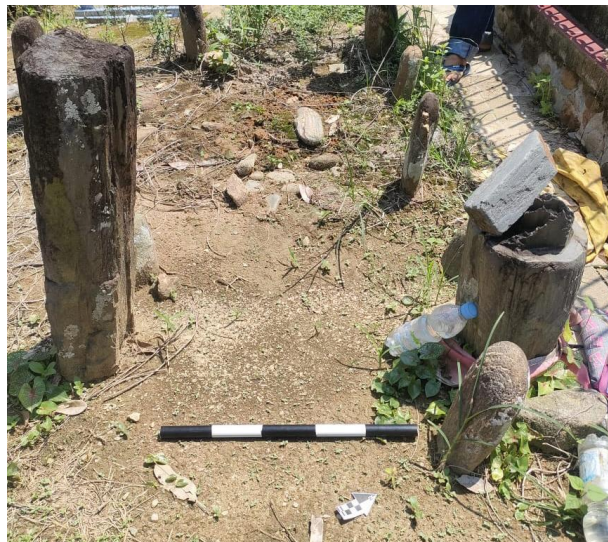
Gambar 5.4 Makam Maruangin Ambe' Ma'a