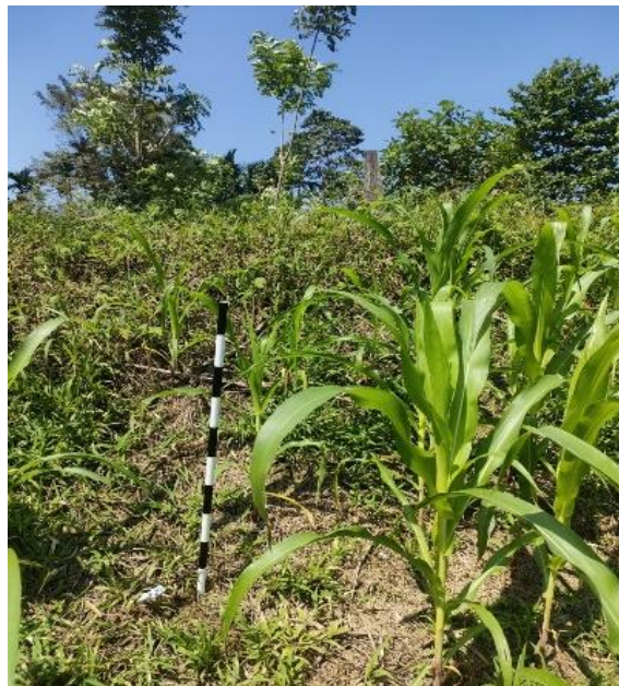
Gambar 5.2 Tampak Benteng Bagian Utara Tampak dari Depan