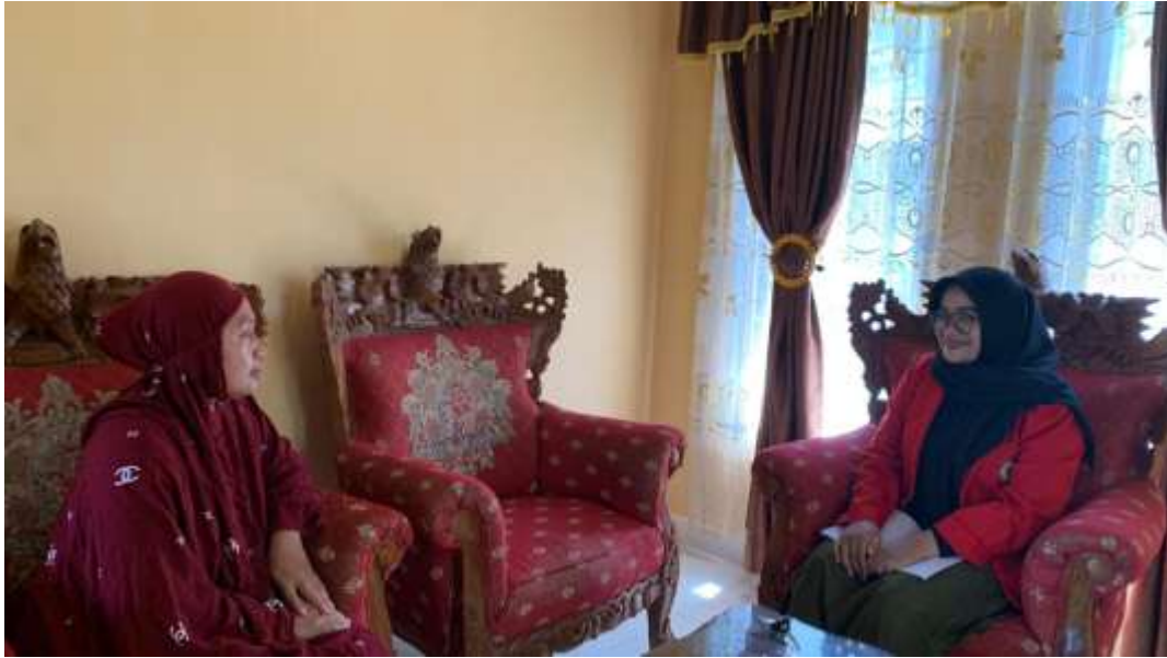
Wawancara dengan Masyarakat