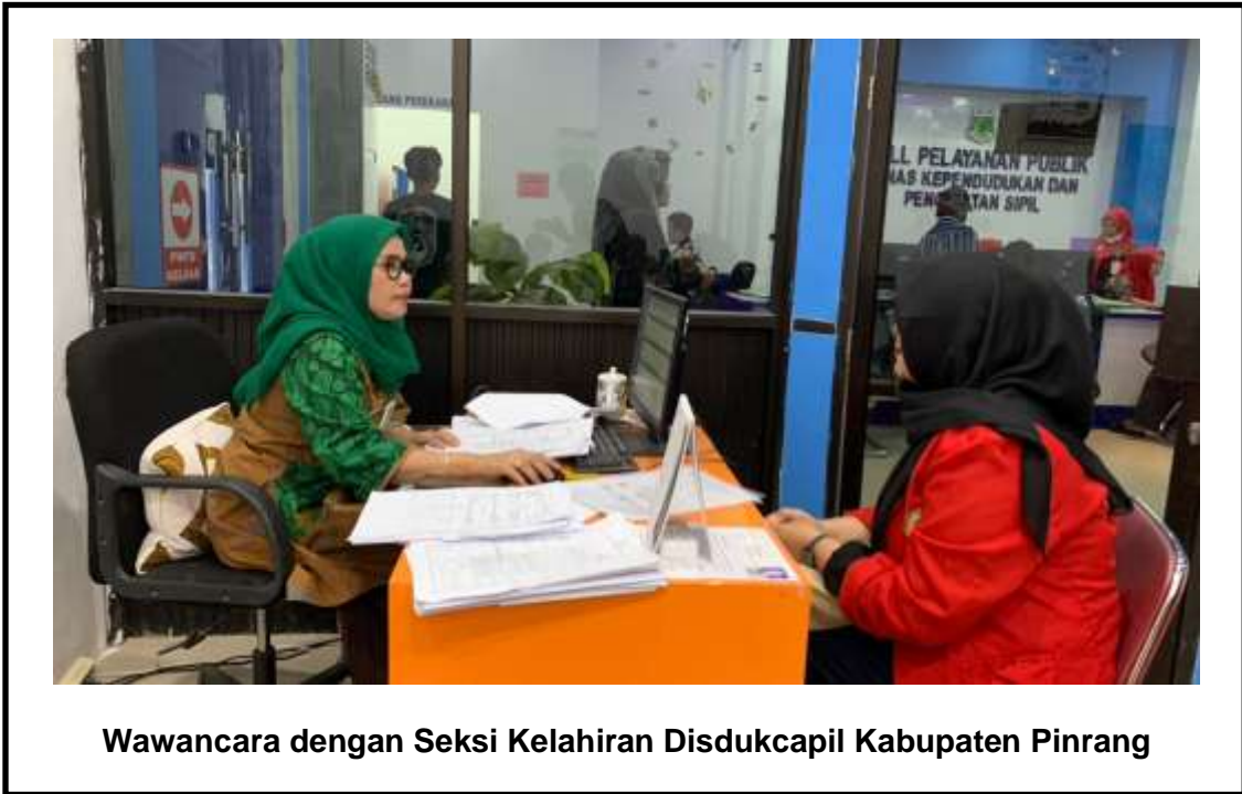
Wawancara dengan Seksi Kelahiran Disdukcapil Kabupaten Pinrang