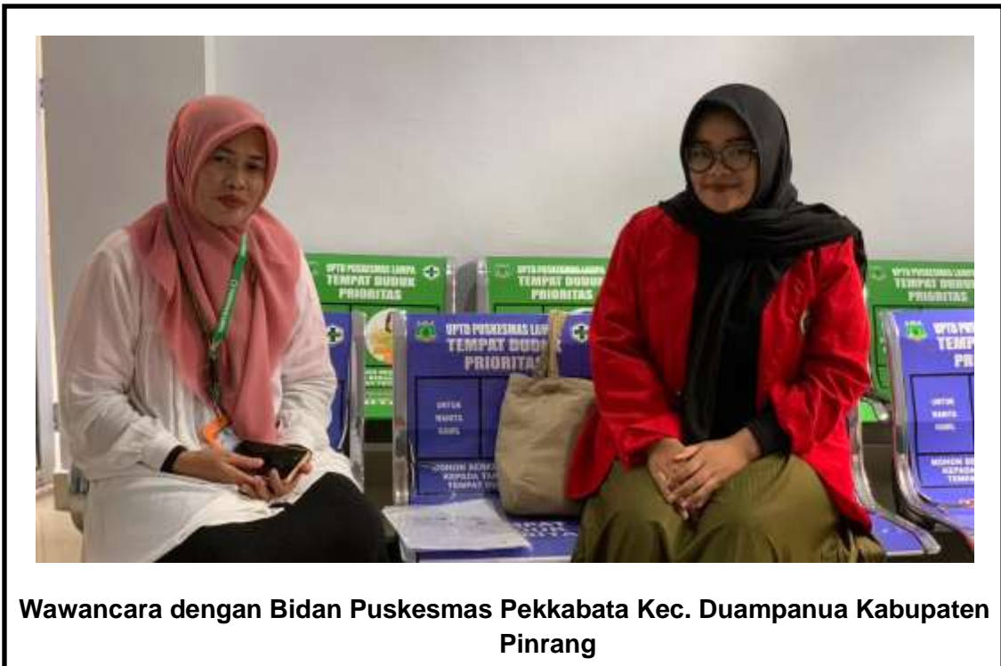
Wawancara dengan Bidan Puskesmas Pekkabata Kec. Duampanua Kabupaten Pinrang