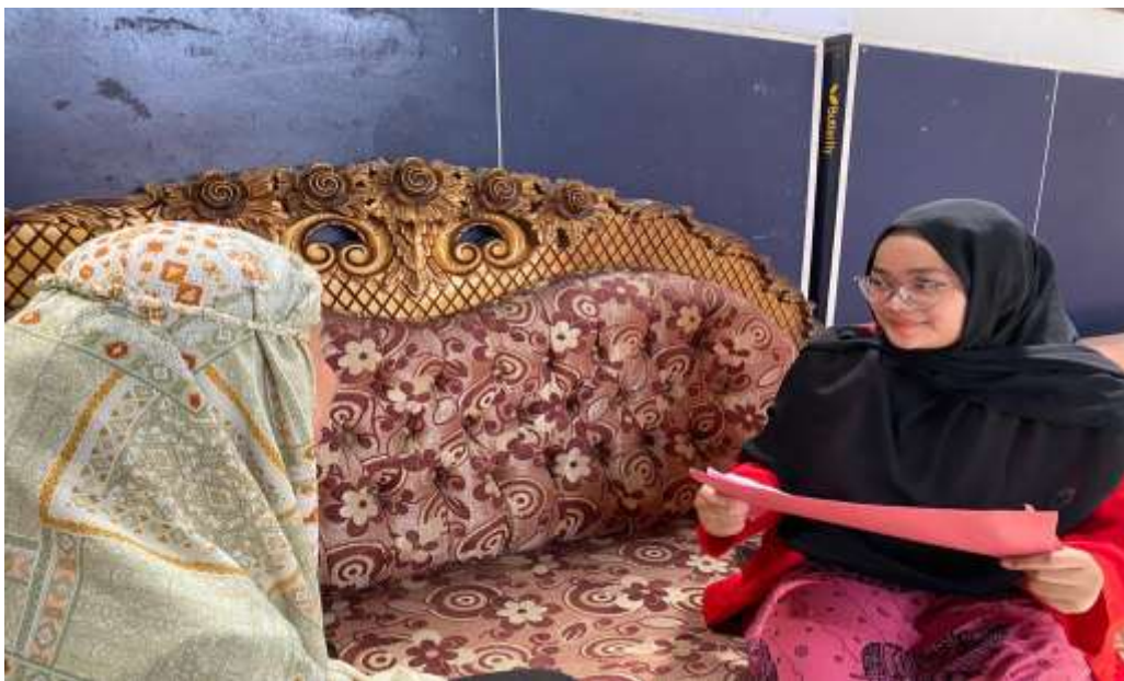
Wawancara dengan masyarakat