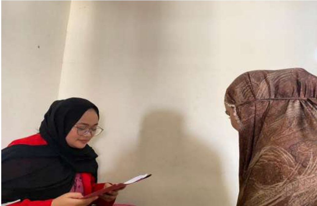
Wawancara dengan Masyarakat