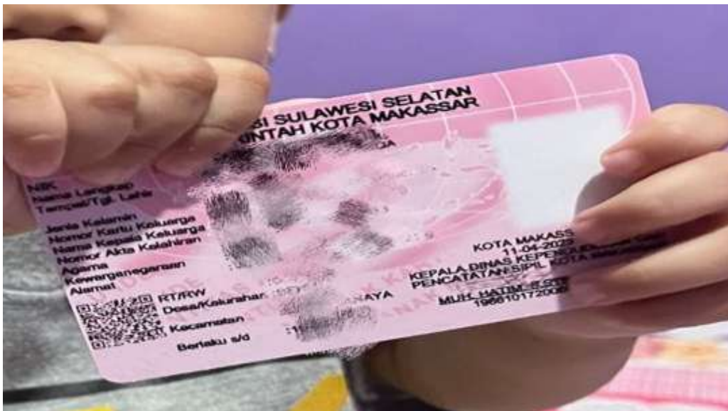
Contoh kartu Identitas Anak