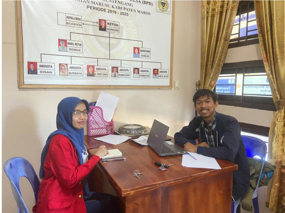
(Wawancara dengan Operator Website Desa pada 08 Juni 2023)