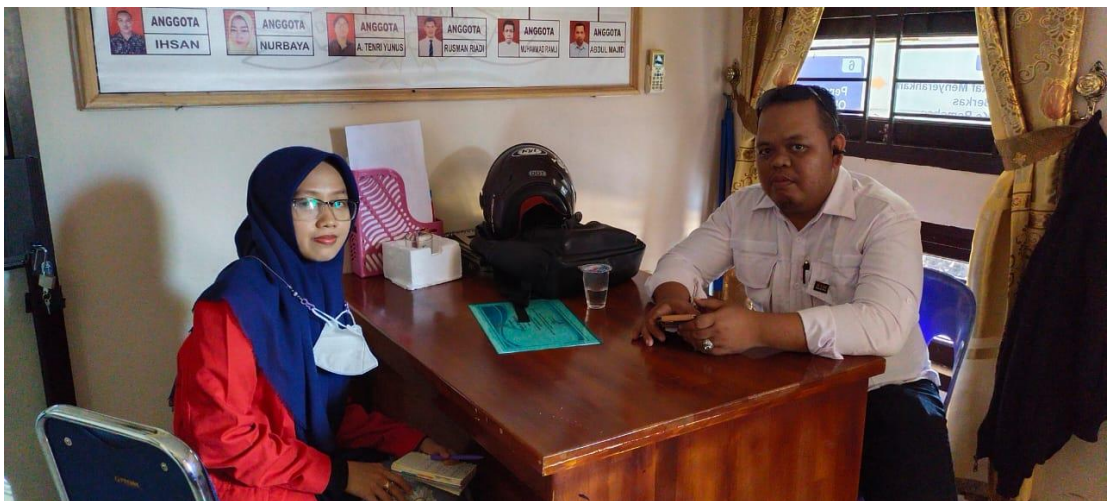
(Wawancara dengan Kaur Keuangan pada 07 Juni 2023)