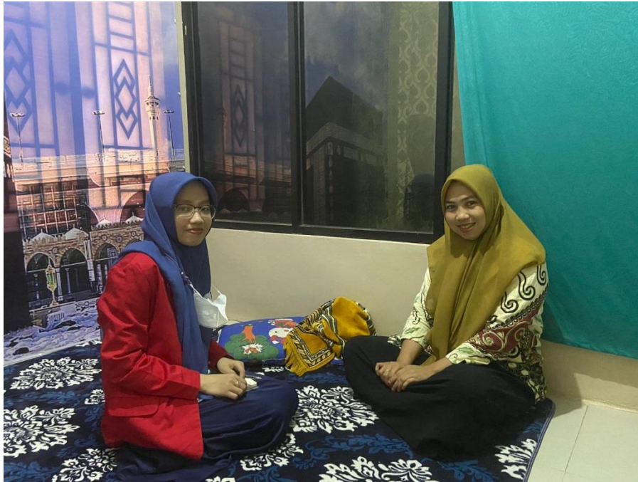
(Wawancara dengan Kaur Umum pada 08 Juni 2023)