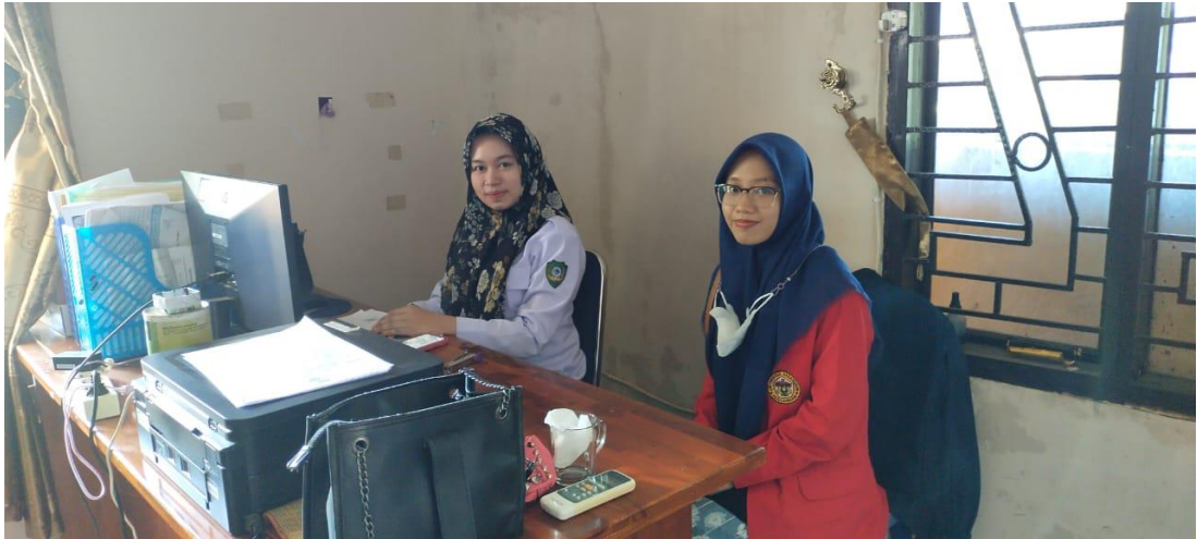
(Wawancara dengan Staf Kasi pada 07 Juni 2023)