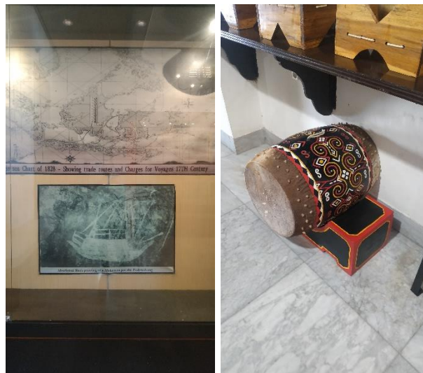
Perahu Padewakang "Jejak Pencari Teripang ke Australia" & Gendang Toraja