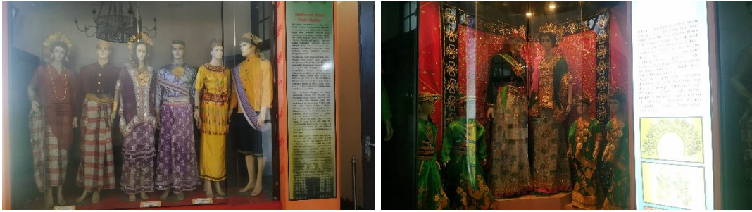
Baju Adat Sulawesi Selatan & Baju Bodo'