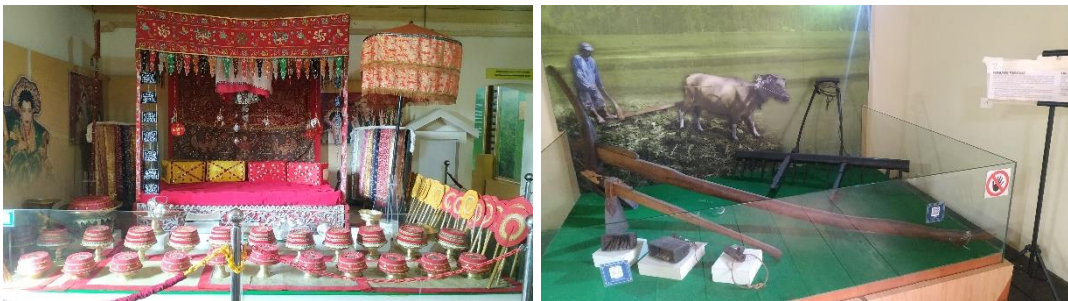
Lamming Tudangeng & Rakkala