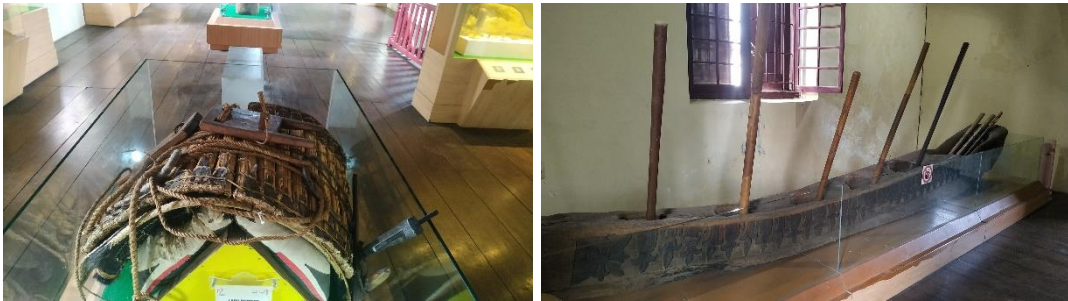
Lapi' Patteke' & Lesung yang digunakan dalam Tarian Padandang