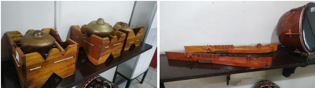
Kannong-Kannong & Kecapi