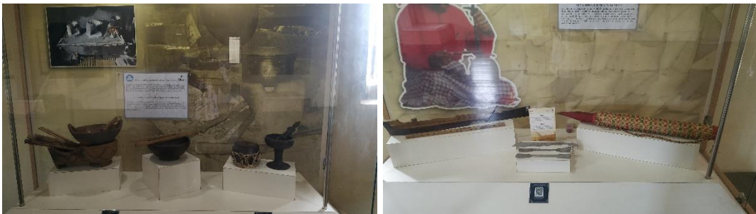
Peralatan Dapur Tradisional & Alat Musik Tradisional