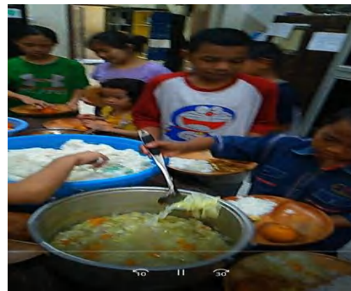
Observasi Penggunaan Piring Makanku di Kelompok Perlakuan