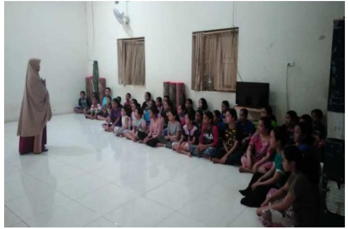
Edukasi Gizi Pekan ke-1 di kedua kelompok penelitian