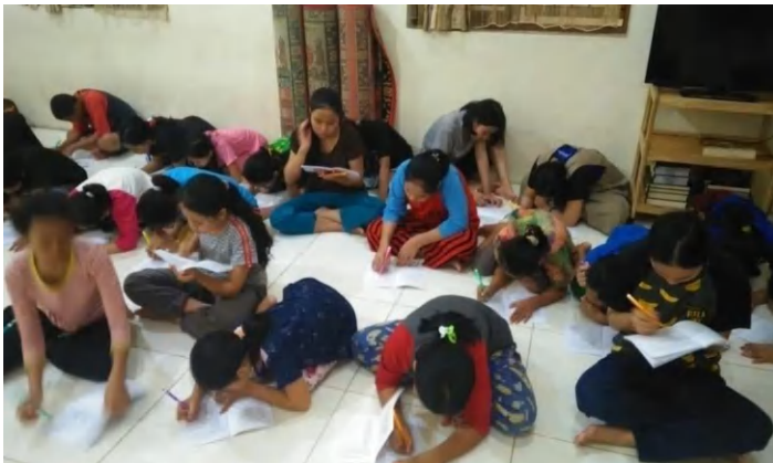
Pre-test di Pantia Asuhan Mulia (Kelompok Perlakuan)