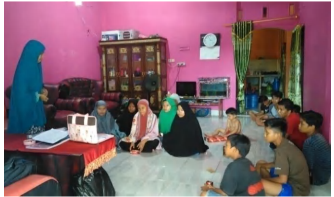
Edukasi Gizi Pekan ke-2 di kedua kelompok penelitian