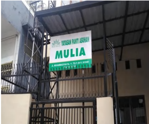
Pantia Asuhan Mulia (Kelompok Perlakuan)