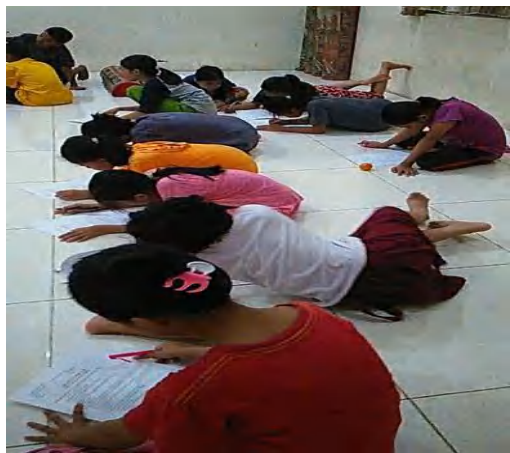
Post-test di Kelompok Perlakuan