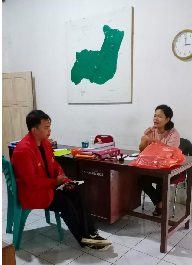
Wawancara bersama Sekretaris Lembang