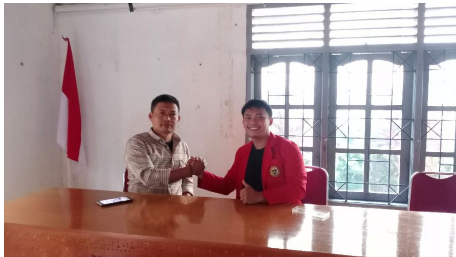
Wawancara Bersama BPL Lembang Rinding Batu