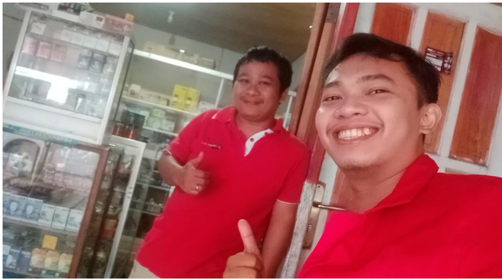
Wawancara Bersama Masyarakat Lembang Rinding Batu