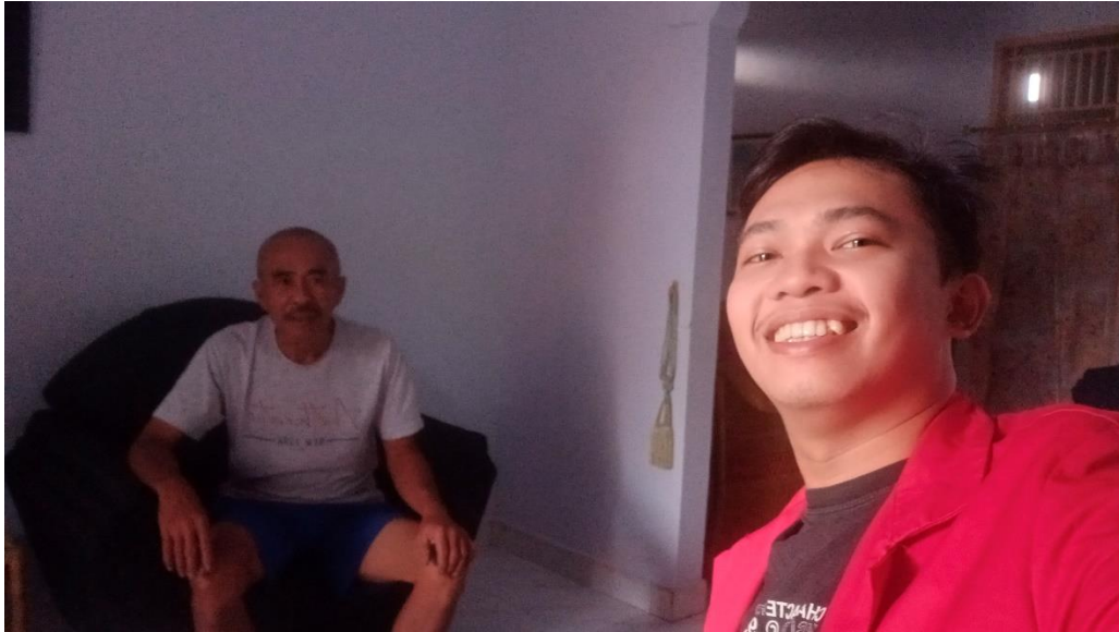
Wawancara Bersama Kepala Kampung Pao, Lembang Rinding Batu