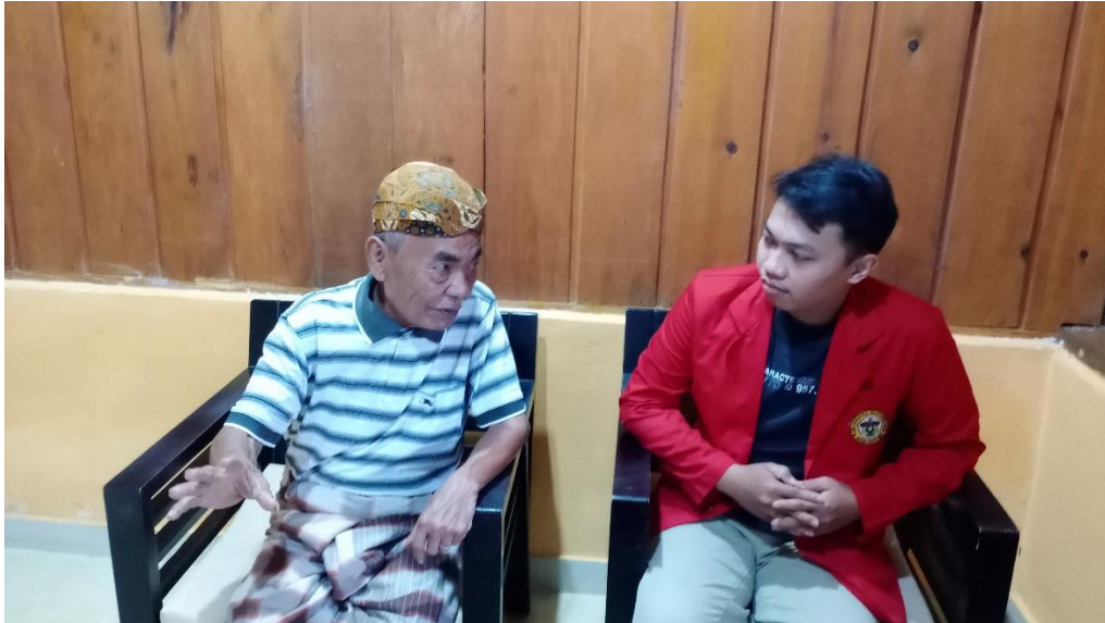
Wawancara Bersama salah satu Tokoh Adat