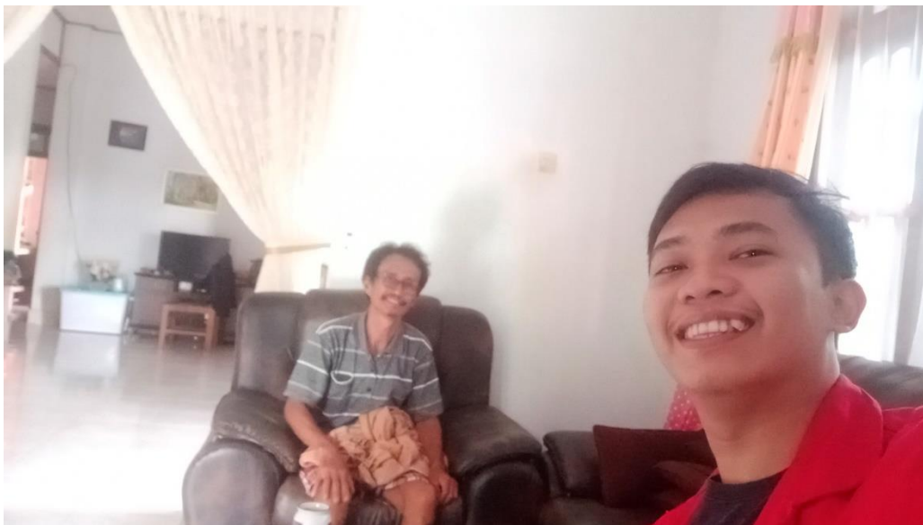
Wawancara Bersama Lembaga Adat Lembang Rinding Batu