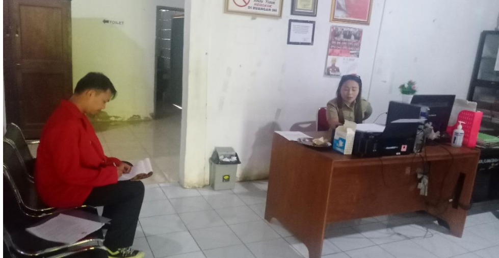
Wawancara Bersama Sekretaris Lembang Rinding Batu