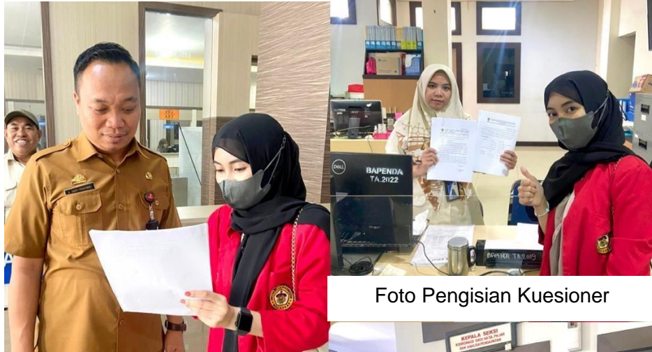
Foto Pengisian Kuesioner