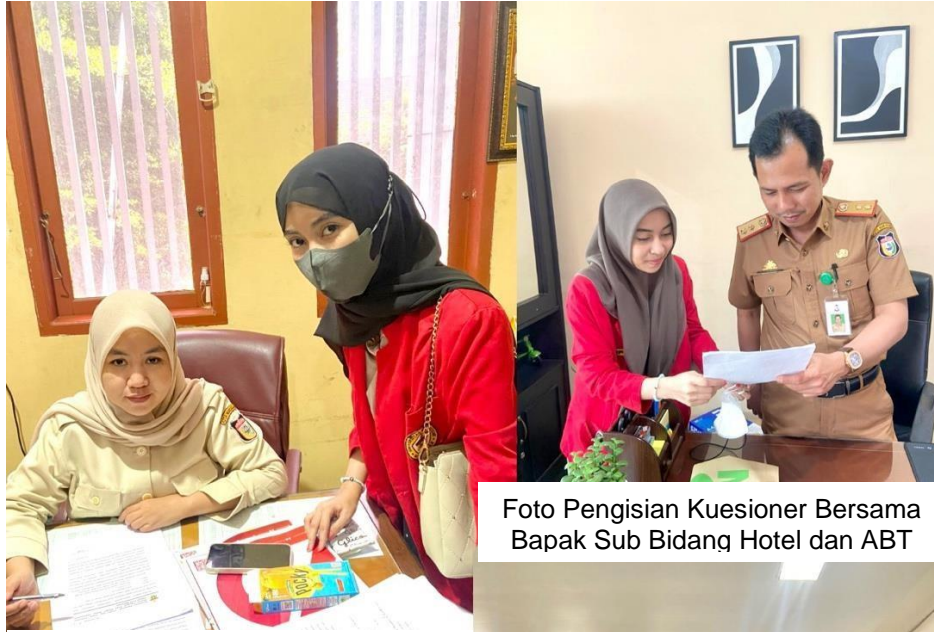
Foto Pengisian Kuesioner Bersama Bapak Sub Bidang Hotel dan ABT