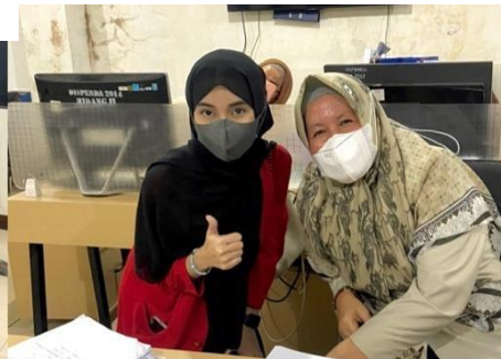
Foto Pengisian Kuesioner