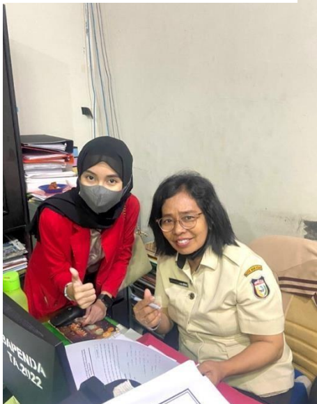
Foto Pengisian Kuesioner