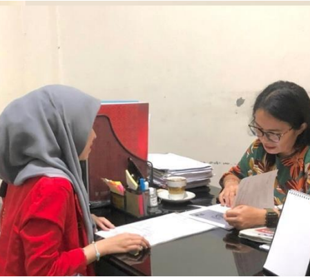
Pengisian Kuesioner Bersama Kepala Sub Bagian Umum dan Kepegawaian