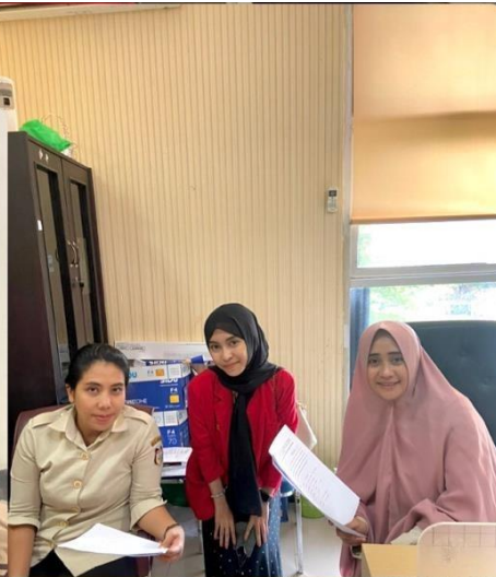
Foto Pengisian Kuesioner