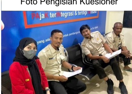
Foto Pengisian Kuesioner