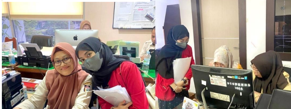
Foto Pengisian Kuesioner