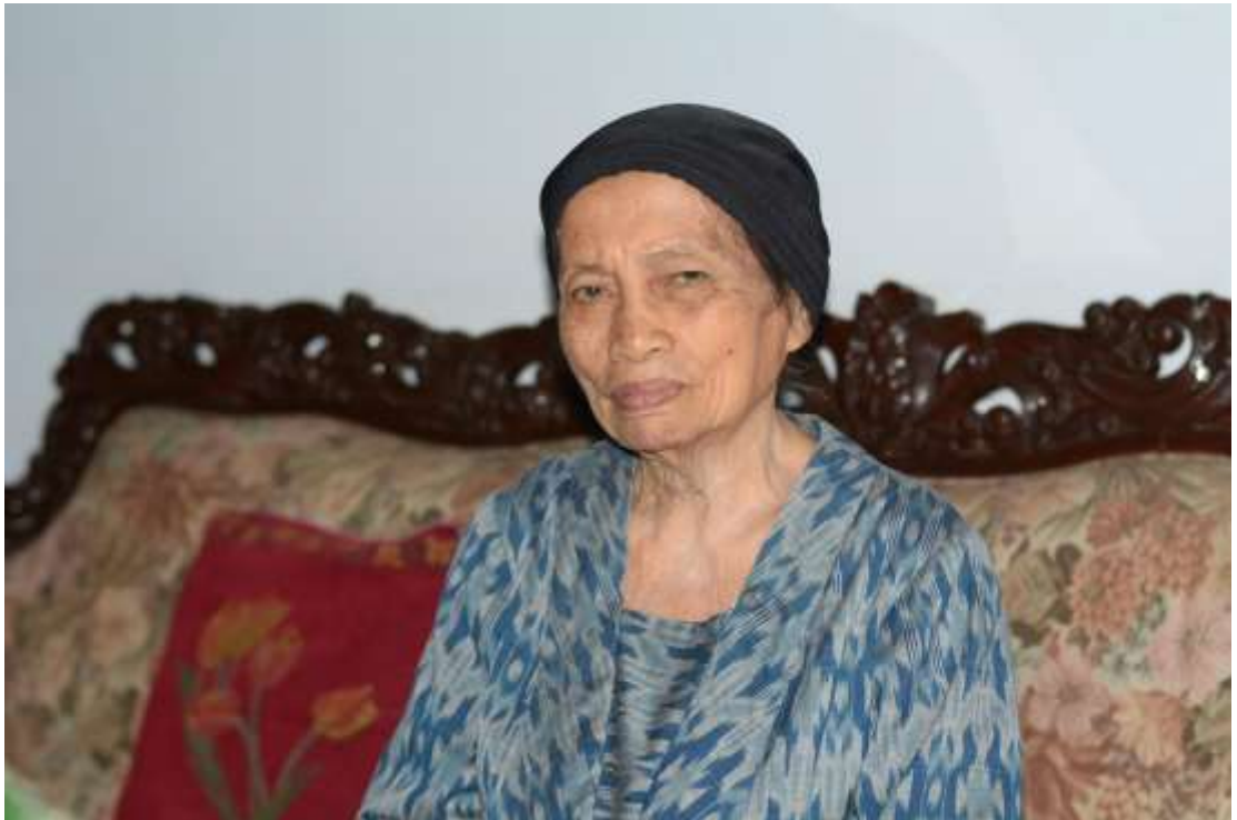
Tahun 2015