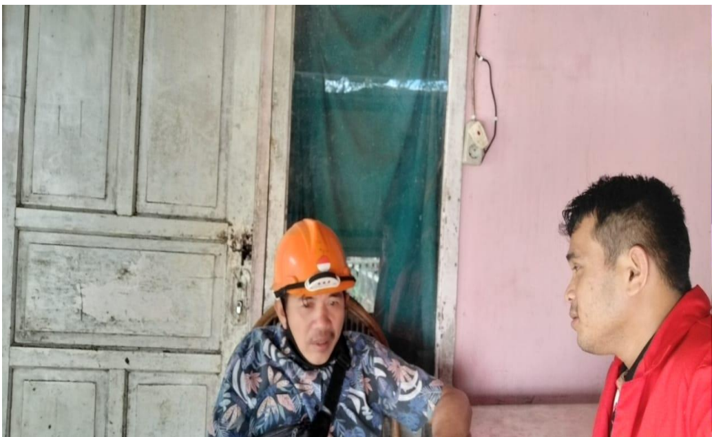
(wawancara petugas sampah Bapak Bdn)