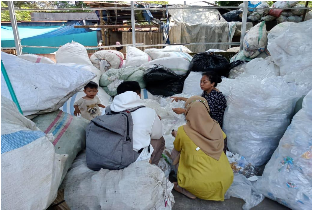
(Wawancara dengan Ck)