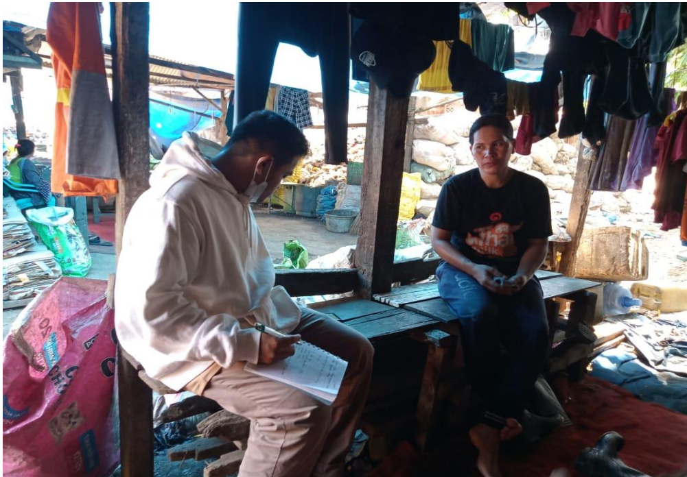
( Wawancara dengan DT)