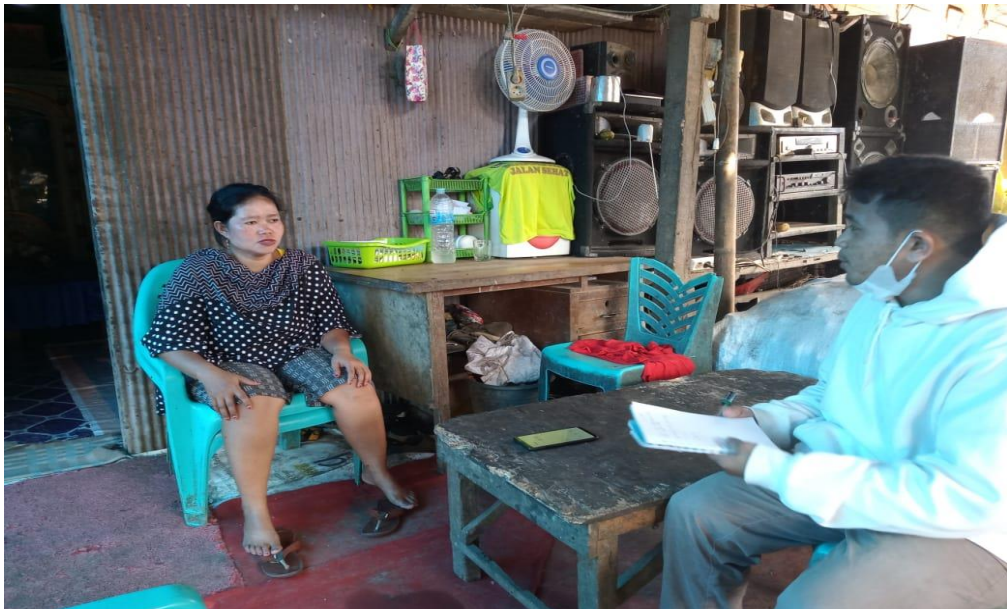
(Wawancara dengan T)