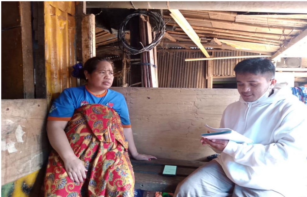
(Wawancara dengan ibu GL)