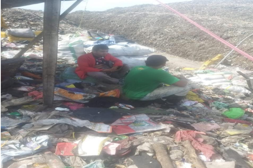
(wawancara dengan AK)