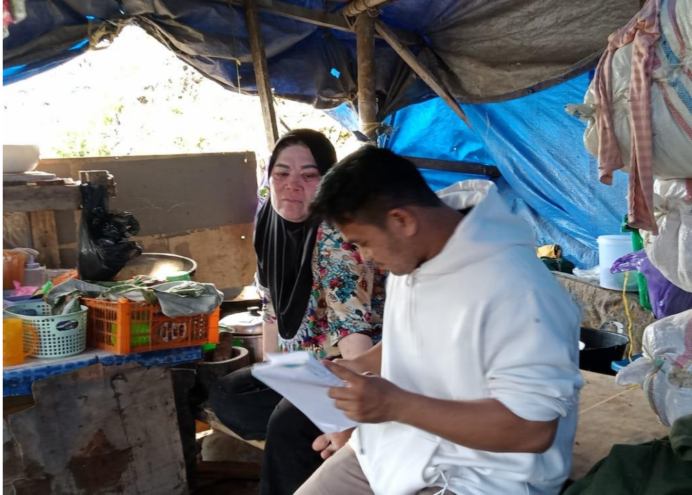
( Wawancara dengan ibu FK)