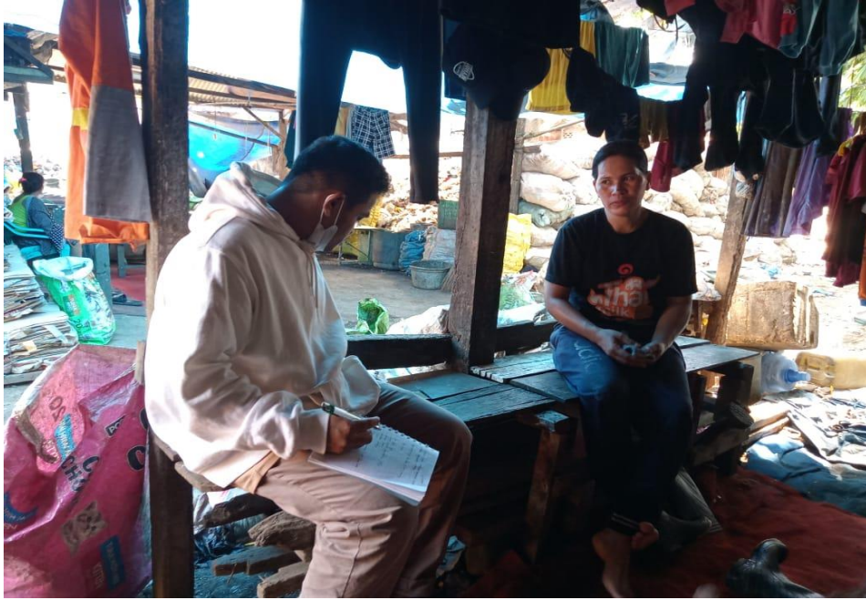
(Wawancara dengan Ibu I)