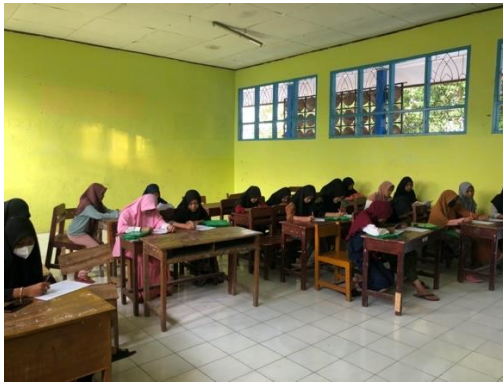
Gambar 13. Posttest Kelompok Intervensi