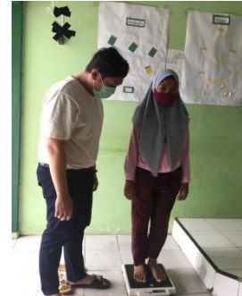
Gambar 2. Pengambilan Data BB