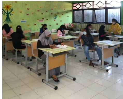
Gambar 14. Posttest Kelompok Kontrol