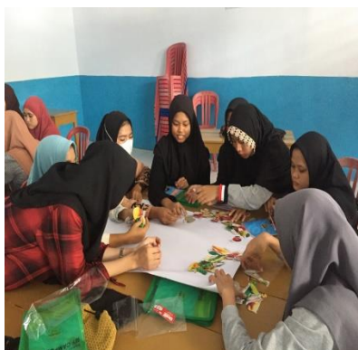
Gambar 7. Proses Edukasi Kelompok Intervensi