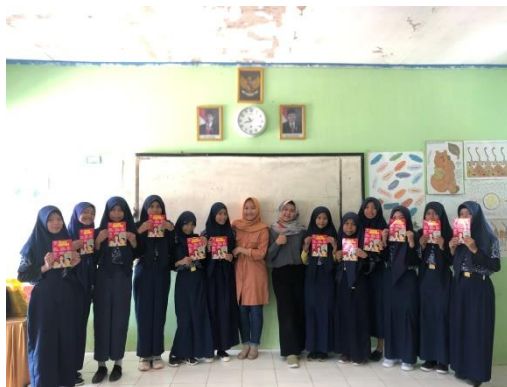
Gambar 9. Pembagian Leaflet Kelompok Kontrol