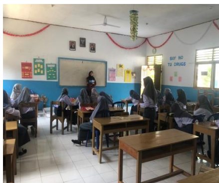
Gambar 8. Proses Edukasi Kelompok Intervensi