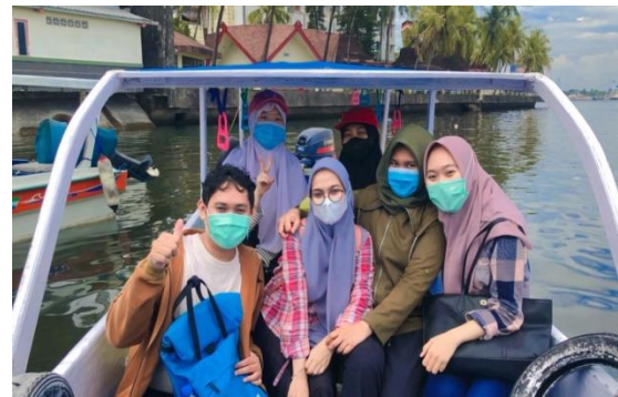
Gambar 4. Perjalanan ke Pulau