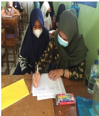
Gambar 3. Wawancara FFQ dan Recall