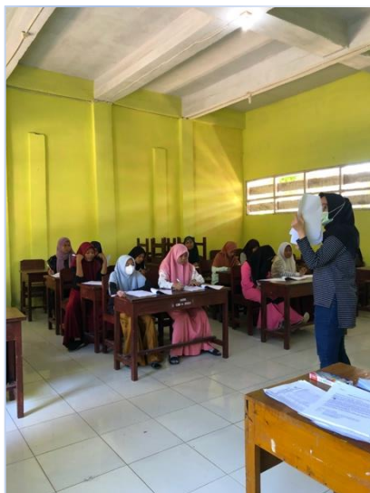
Gambar 5. Pretest Kelompok Intervensi