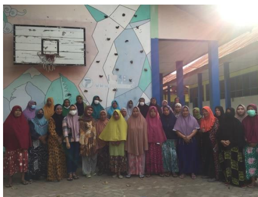
Gambar 11. Foto sesudah edukasi kepada orang tua responden