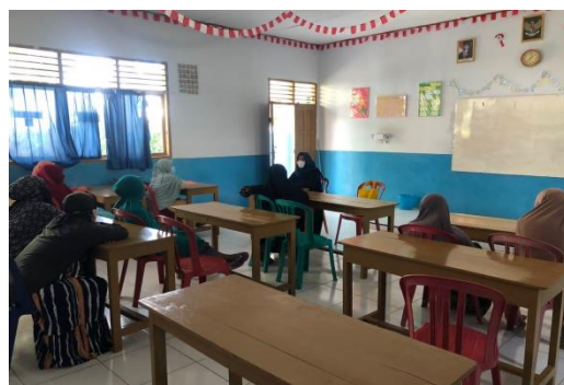
Gambar 12. Foto edukasi kepada orang tua responden