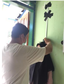
Gambar 1. Pengambilan Data TB