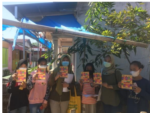
Gambar 10. Pembagian Leaflet Kelompok Kontrol