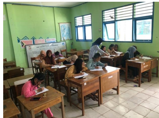
Gambar 6. Pretest Kelompok Kontrol