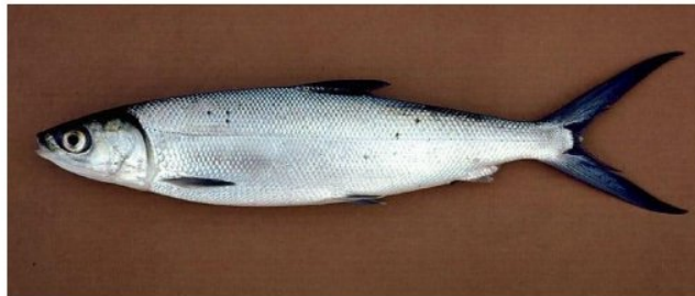
Gambar 1. Morfologi Ikan Bandeng (Dokumentasi pribadi. 2022)

Ikan bandeng secara morfologi dicirikan dengan bentuk memanjang berbentuk seperti torpedo. Sirip ekornya bercabang, pada bagian tubuhnya tersusun sisik-sisik kecil yang teratur membentuk cycloid . Tubuhnya berwarna putih keperakan terutama pada bagian perut (ventral), sedangkan pada bagian punggung (dorsal) warnanya birukehitaman. Garis linea lateralis jelas terlihat memanjang dari bagian belakang tutupinsang sampai ke pangkal ekor (Aidah,. 2020).