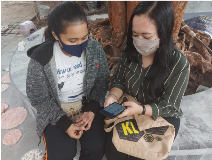
Kegiatan uji coba efektivitas aplikasi pada sampel besar