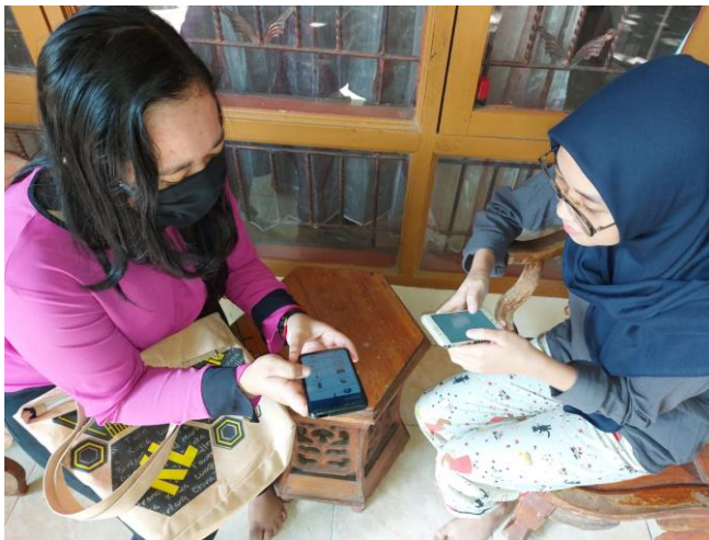
Kegiatan pengguna aplikasi (sampel kecil)