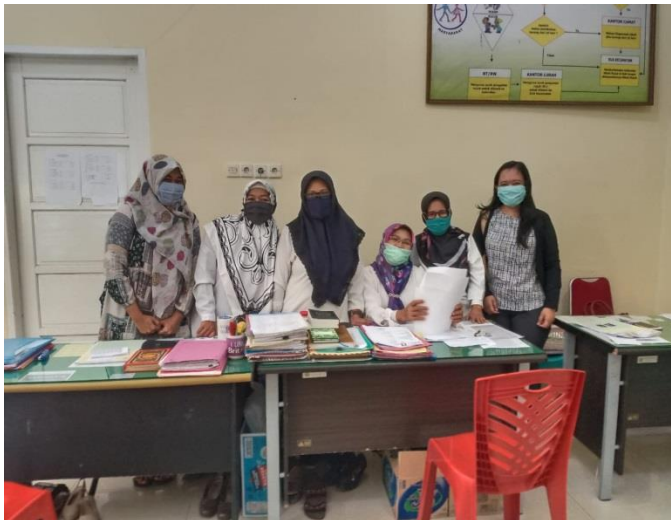
Kegiatan studi pengetahuan awal bersama dengan petugas KUA Biringkanaya