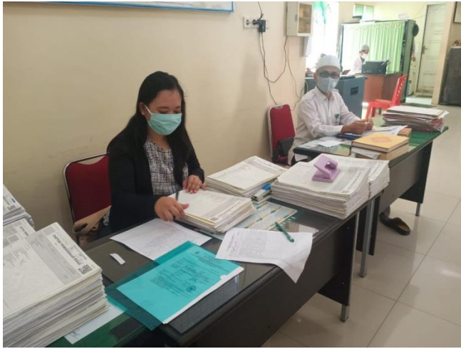
Kegiatan pengambilan data penelitian