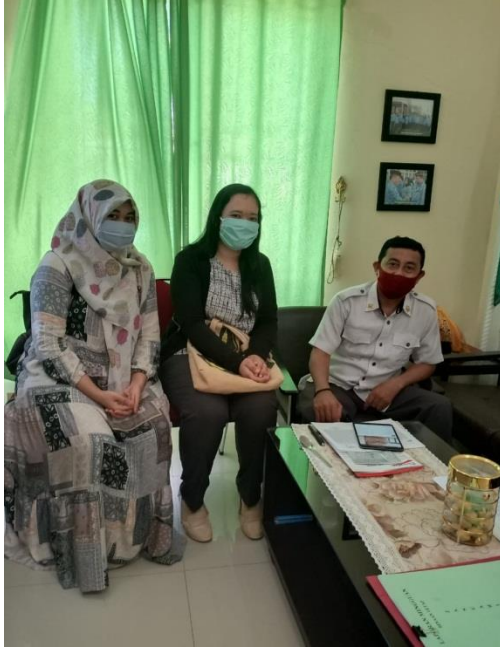
Kegiatan meminta perizinan penelitian kepada ketua KUA Biringkanaya