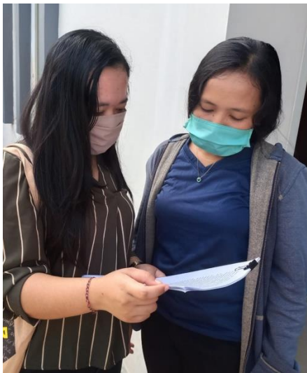
Kegiatan pemberian media printout