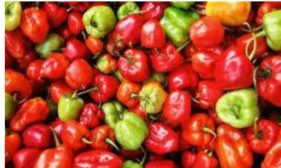
Gambar 1. Cabai Katokkon

Cabai katokkon merupakan salah satu jenis cabai yang berasal dari Tana Toraja. Cabai khas Toraja ini memiliki bentuk menyerupai paprika dalam bentuk kecil dengan ukuran berkisar 3-4 cm dan penampang seukuran 2-3,5 cm. Cabai katokkon memiliki aroma yang wangi serta tingkat kepedasan yang tinggi (Amaliah,2018).