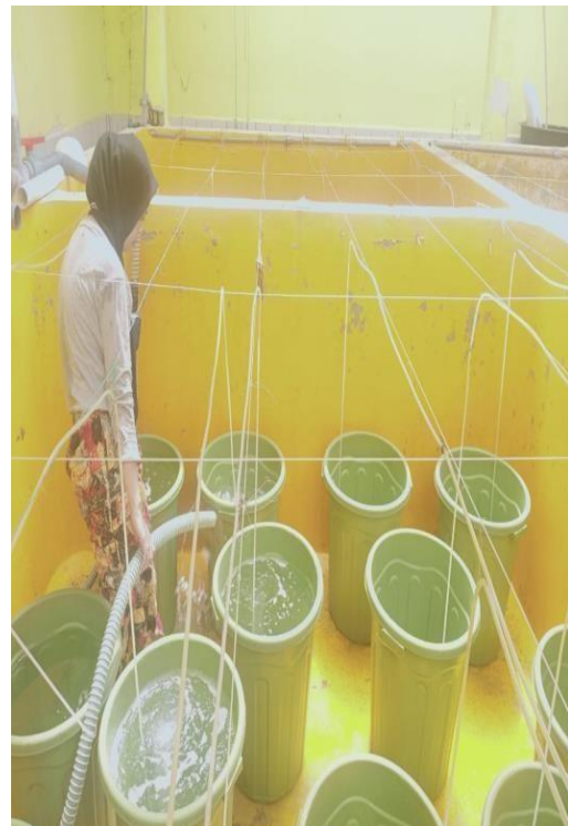
Gambar 10 . Pengisian air