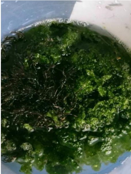
Gambar 3. Perendaman rumput laut

Lampiran 10. Dokumentasi kegiatan penelitian