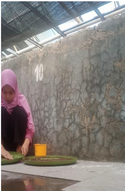
Gambar 9. pengeringan pakan