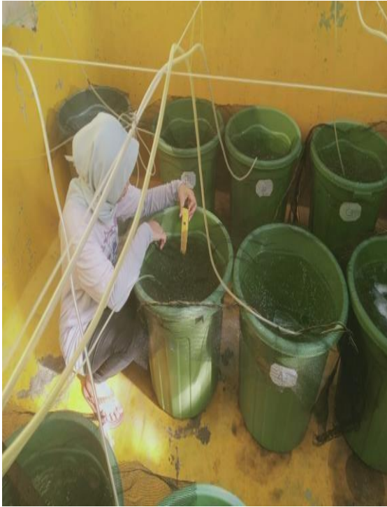
Gambar 15 Pengukuran pH