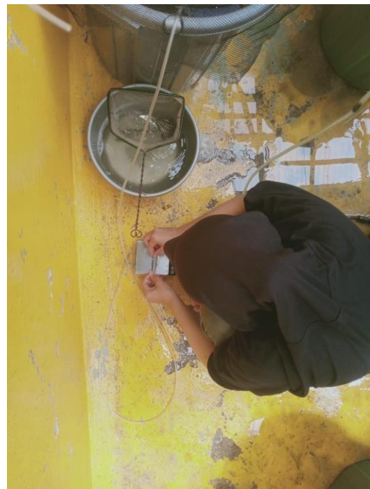
Gambar 18. pengukuran bobot akhir ikan