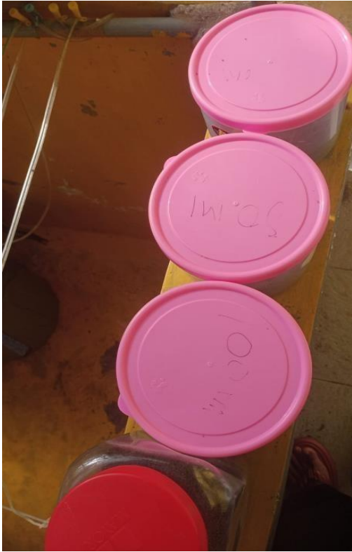
Gambar 11 . Penyimpanan pakan