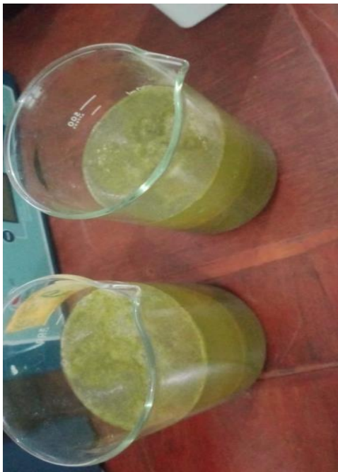
Gambar 5 Rumput laut yang akan diekstrak