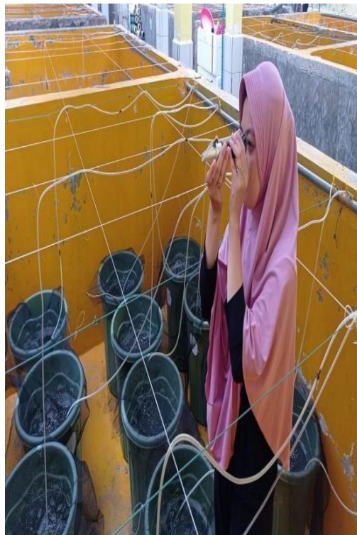
Gambar 14. Pengukuran salinitas