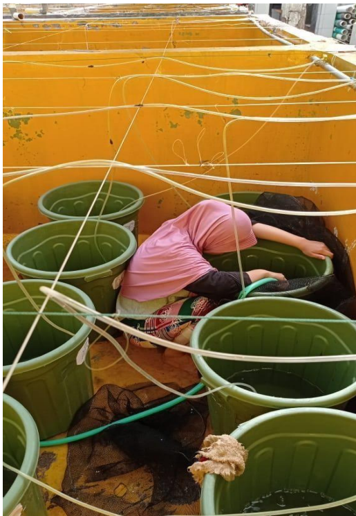
Gambar 13 Penyiponan