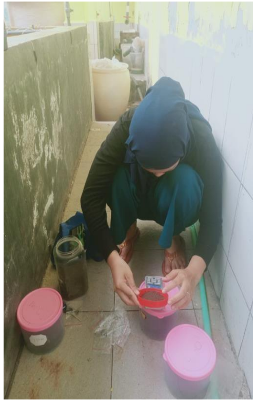
Gambar 12. Penimbangan pakan