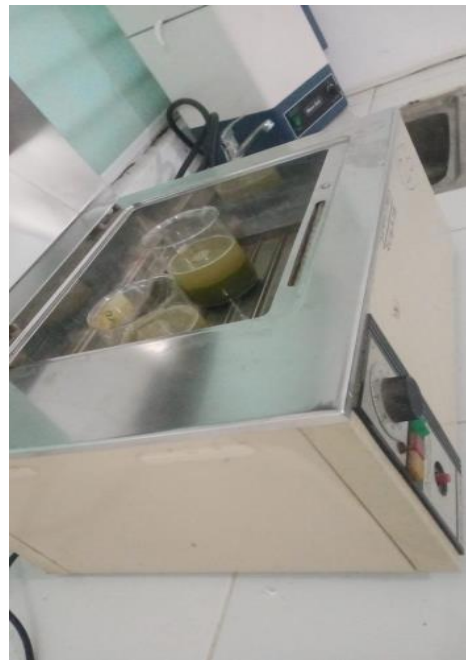
Gambar 6 . Di masak pada waterbath