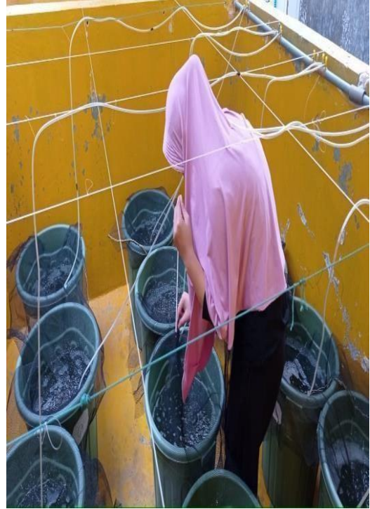
Gambar 16. Pengukuran suhu