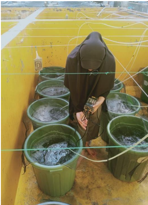
Gambar 17. Pengukuran Do