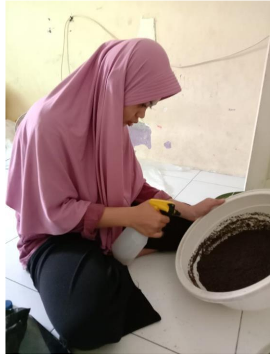
Gambar 7. Penyemprotan ekstrak