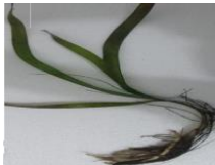
Gambar 1. Enhalus acoroides (Rawung dkk., 2012)

Species : Enhalus acoroides (Irawan dan Matuankotta, 2015)