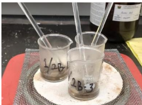
Gambar 7. Proses destruksi