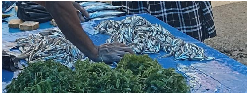
Gambar 3. Pengambilan sampel