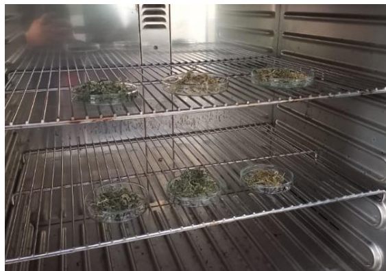
Gambar 5. Pengujian kadar air