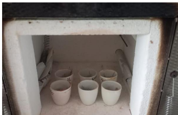
Gambar 6. Pengujian kadar abu dalam tanur