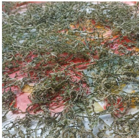
Gambar 4. Pengeringan dibawah sinar matahari