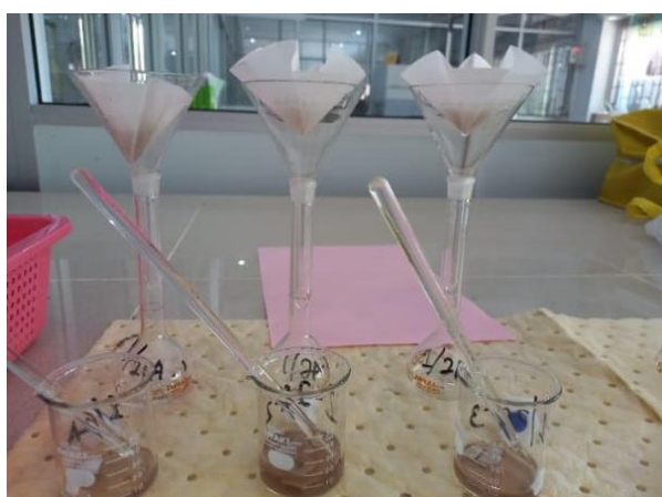
Gambar 8. Proses penyaringan