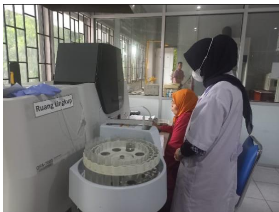
Gambar 9. Proses analisis