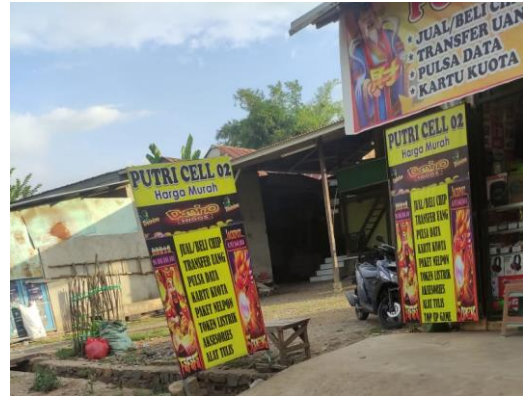
Gambar 8. Observasi Mitra Domino.