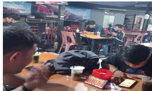
Gambar 10. Mabaz Judi Slot Online.