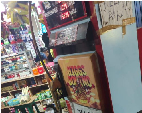
Gambar 7. Observasi Lapak jual beli chip domino higgs island.