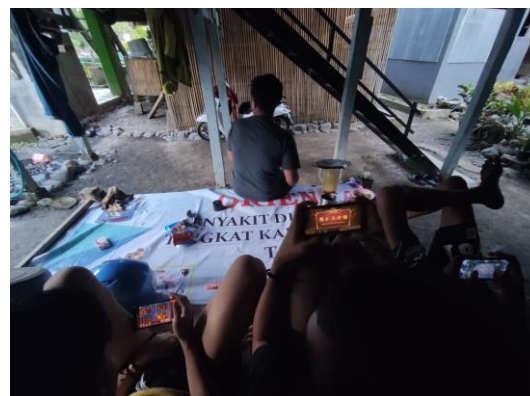
Gambar 6. Observasi cara kerja Judi Slot Online.