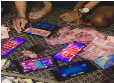
Gambar 11. Transaksi chip antar pemain dengan bandar