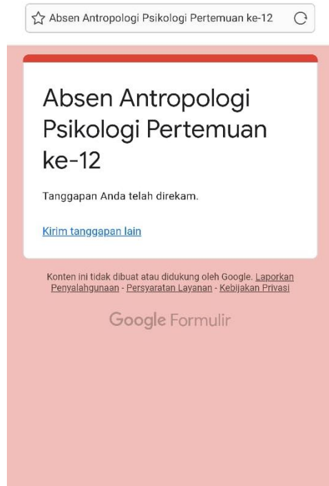
Gambar 5. Bukti Absen Google Form