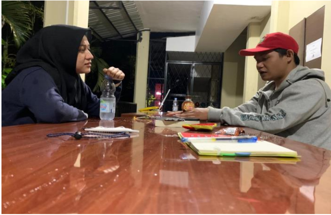
Gambar 7. Dokumentasi Wawancara Dengan Informan