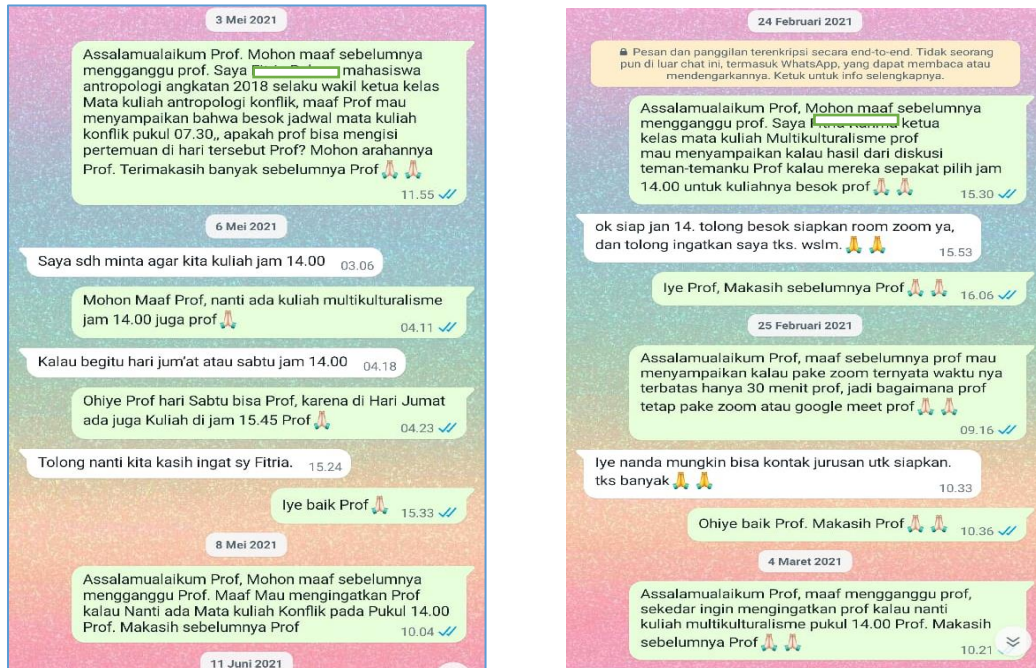
Gambar 4. Bukti Chat Dengan Dosen