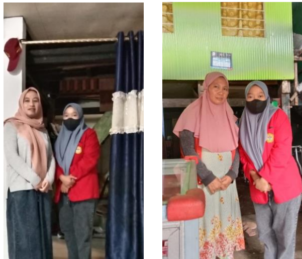
Wawancara bersama Masyarakat Kecamatan Panakukang