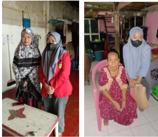
Wawancara bersama Masyarakat di Kecamatan Ujung Tanah