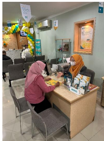
Proses pembuatan buku tabungan