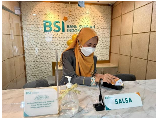
Pembuatan pin untuk nasabah