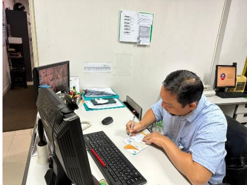
Penandatanganan buku tabungan oleh supervisor