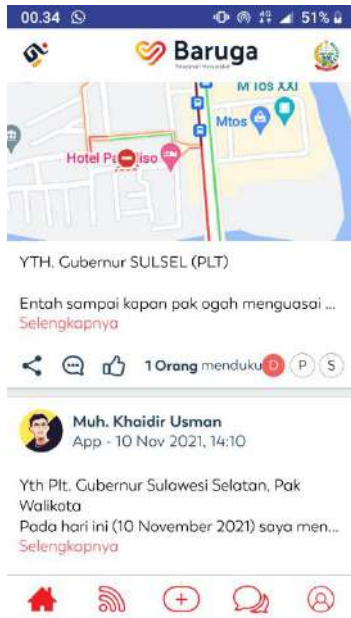
TAMPILAN BARUGA SULSEL