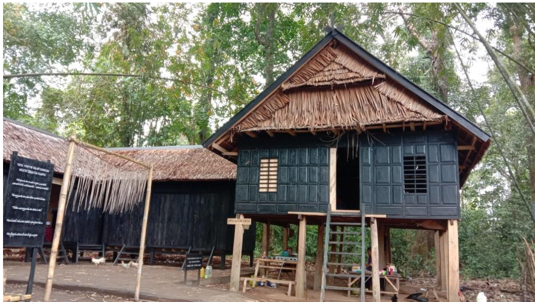
Gambar 2 Rumah adat suku Kajang

Selain itu, tiang-tiang rumah ditanam sepanjang satu meter, hal tersebut berarti bahwa tanah merupakan unsur kehidupan sehingga kita tidak bisa lepas atau berpisah dengan tanah. Unsur kehidupan manusia