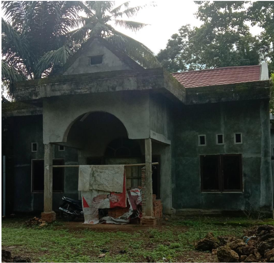
Gambar 1 Rumah Batu

Salah satu tokoh adat, Sangkala memaparkan bahwa masyarakat suku kajang menolak modernisasi dikarenakan hanya akan merusak kampung dan membuat masyarakat saling terpecah belah karena hanya akan mementingkan diri sendiri. Dalam masyarakat adat akan tumbuh rasa egois, ingin memiliki sendiri tanah, kekayaan alam sehingga itu yang kami hindari. Makanya sampai sekarang kami masih tetap berpegang teguh pada prinsip tallassa kamase-masea . 104