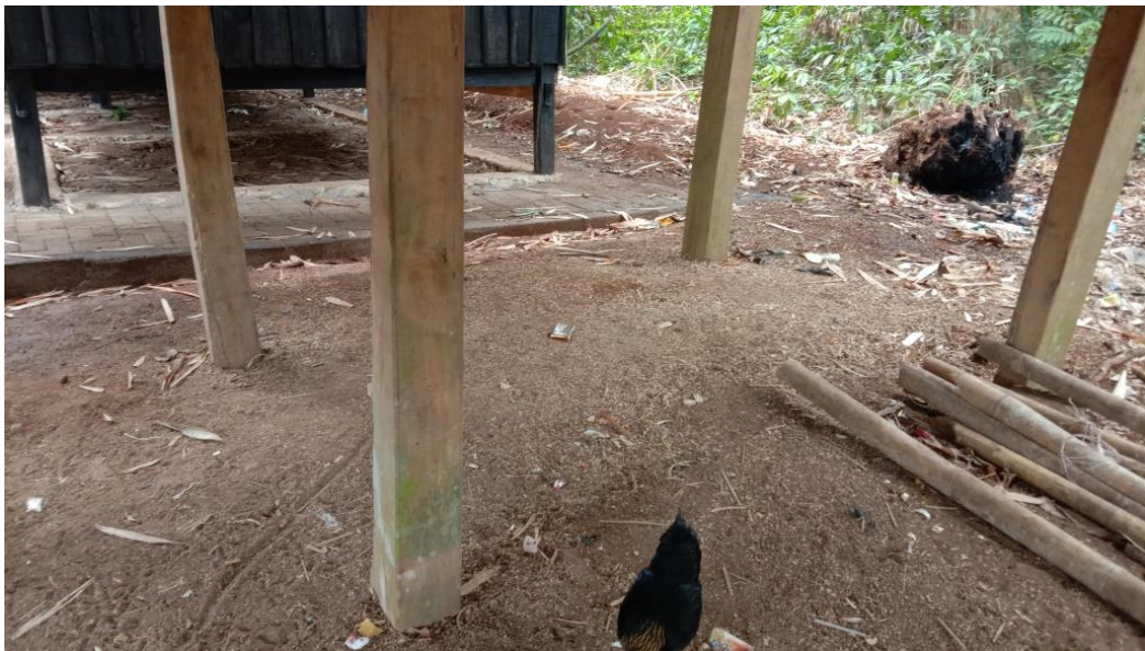
Gambar 3 Tiang rumah adat suku Kajang

Selain itu, posisi rumah suku kajang menghadap kearah barat atau mengarah kearah kabbah. Karena di dalam wilayah adat tidak ada mesjid sehingga rumah dihadapkan kearah kabbah. 109 Rumah ini merupakan turunan mulai dari tahun 1 sampai sekarang bentuk rumah suku Kajang