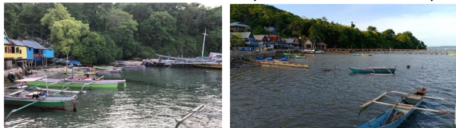
Kondisi Dermaga dan Perahu Nelayan Dusun Dongkalang