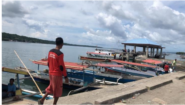
Dermaga Penyebrangan Padang Menuju Desa Bontoborusu