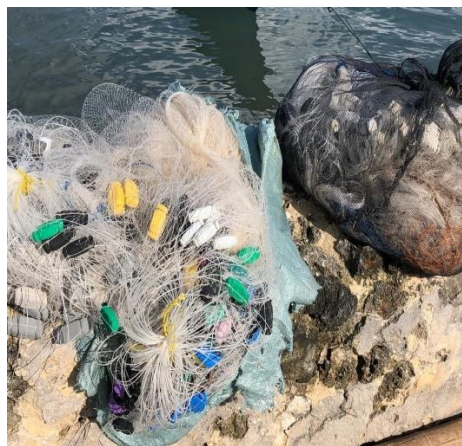
Peralatan Melaut Nelayan Dusun Manarai dan Paoiya