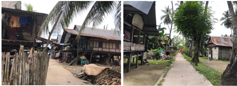
Kondisi Permukiman Dusun Dongkalan Desa Bontoborusu