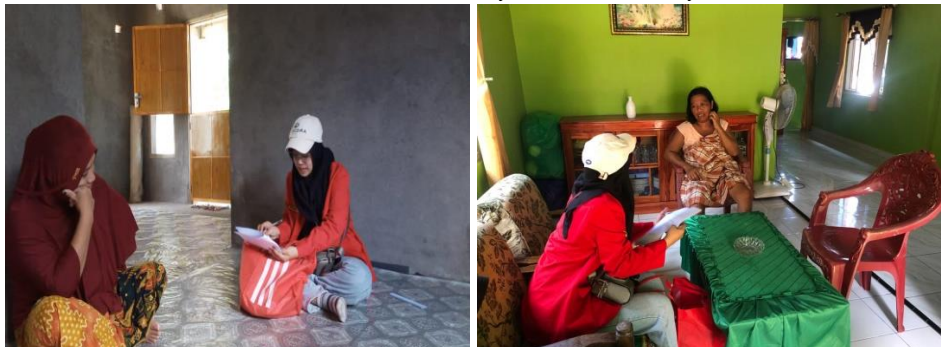
Wawancara Istri Nelayan Dusun Dongkalang