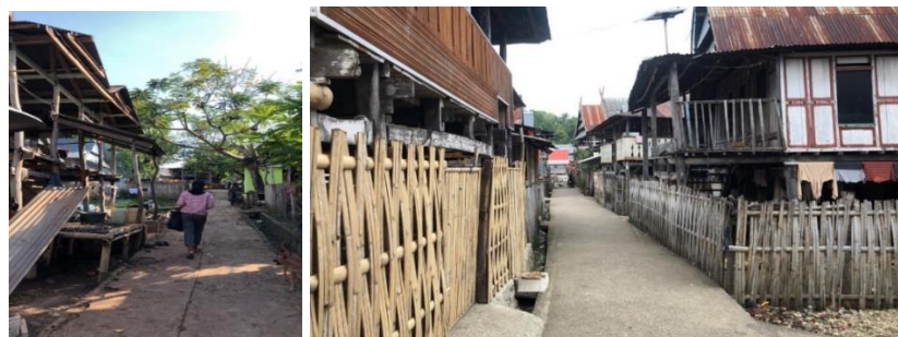
Kondisi Permukiman Dusun Paoiya Desa Bontoborusu