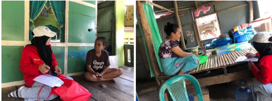
Wawancara Istri Nelayan Dusun Dongkalang