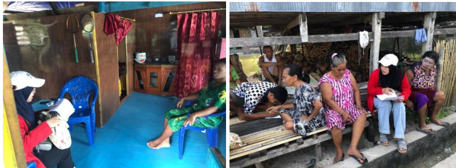
Wawancara Istri Nelayan Dusun Paoiya