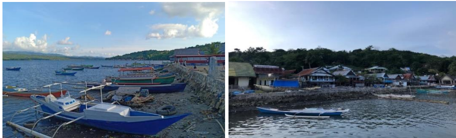
Kondisi Permukiman dan Perahu Nelayan Dusun Manarai Dan Paoiya