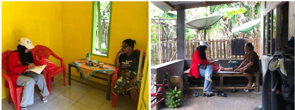
Wawancara Istri Nelayan Dusun Dongkalang