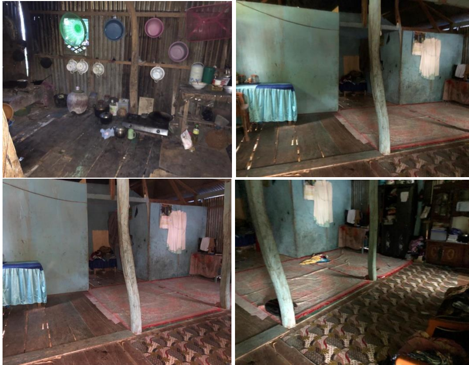
Kondisi Rumah Salah Satu Istri Nelayan di Dusun Paoiya