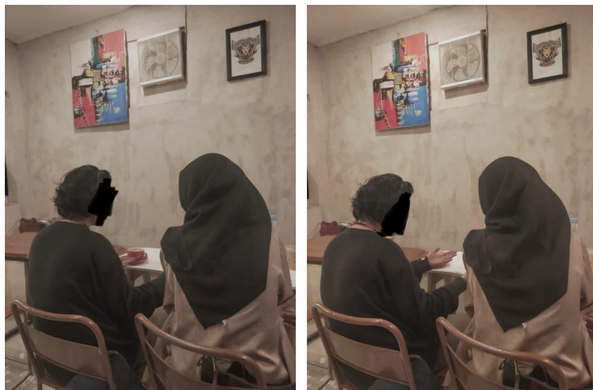
Gambar 2. Dokumentasi dengan Informan

(Foto ini didokumentasikan ketika penulis ikut bergabung dalam pertemuan yang dilakukan informan dengan teman sesama lesbiannya. Dokumentasi dilakukan di salah satu kafe yang terletak di daerah Serigala, Kota Makassar)