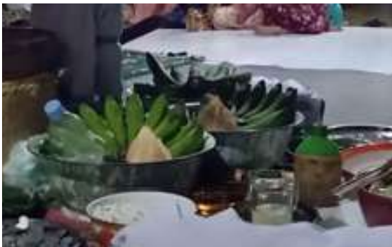
Pisang, kelapa, gula