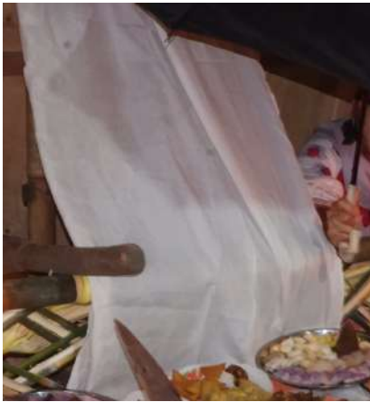
Kain kafan yang diampar