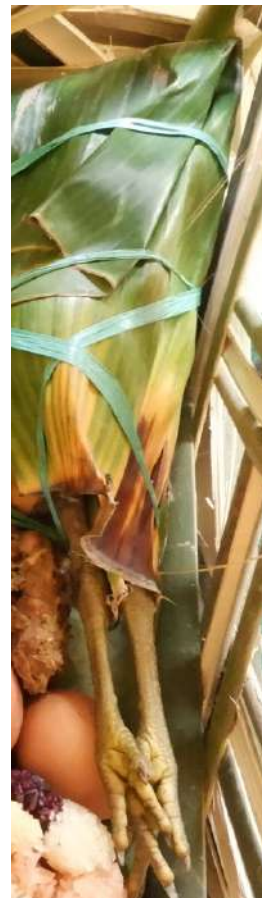
Ayam kampung utuh