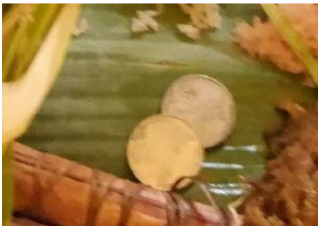
Pete-pete atau uang logam