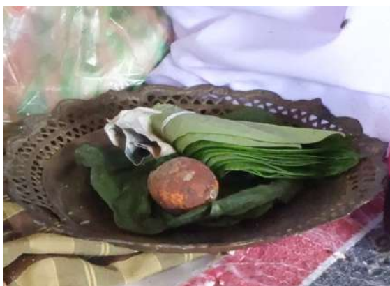
Ota atau daun sirih