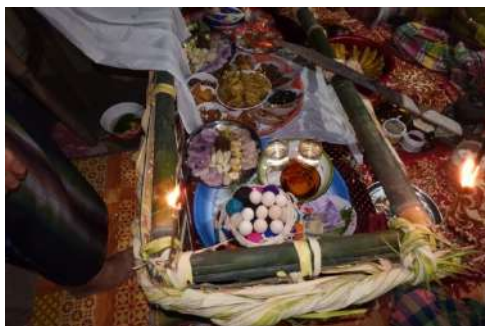
Telur, sokko, kue, nasu manu lekku