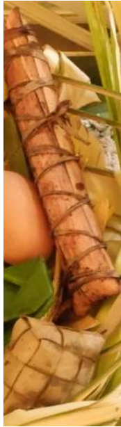
Leppel-leppe & bokong