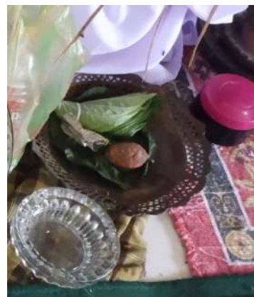
Alosi atau pinang