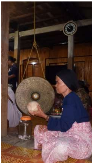
Gong & kelapa