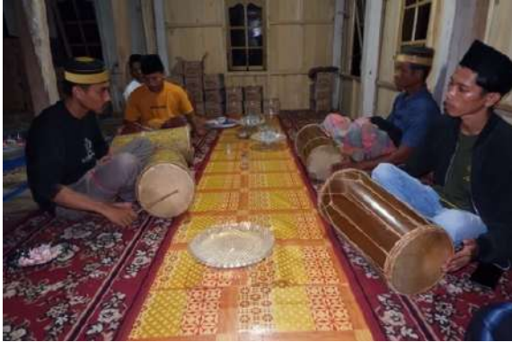
Gendang fattampa dewata