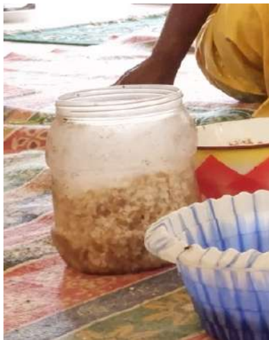
Benno bere atau cucu banna