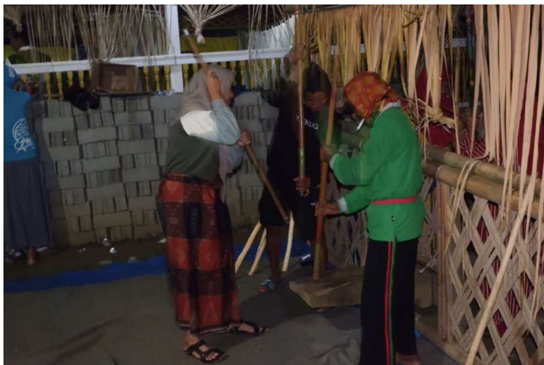
Peneliti ikut terlibat dalam prosesi mappadandang