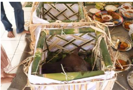
Walasoji & ulu tedong