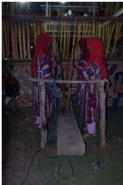
Alu & lesung