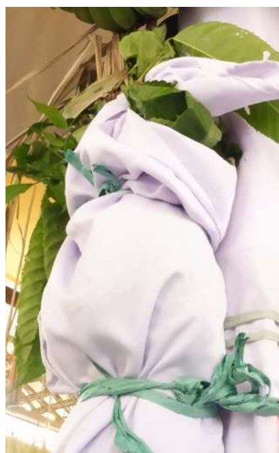
Kain kafan & daun yang digunakan