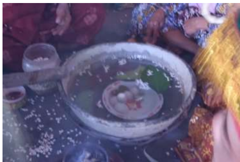
Baskom, air, telur