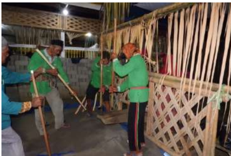
Gambar 1.2 Pakkambo'na (Laki-laki)

Prosesi mappadendang ini merupakan bentuk tradisional yang sering dilakukan dengan menggunakan alat yang bernama alu dan lesung yang akan menghasilkan bunyian irama yang teratur. Ada dua macam pemain dalam prosesi mappadendang ini, yaitu pemain perembuat yang disebut dengan pakkindo'na sedangkan laki-laki yang menari serta menabuh bagian ujung lesung disebut dengan pakkambo'na . Prosesi mappadendang yang diselenggarakan di Desa Baringeng ini di dalamnya hadir berbagai macam simbol-simbol komunikasi nonverbal.