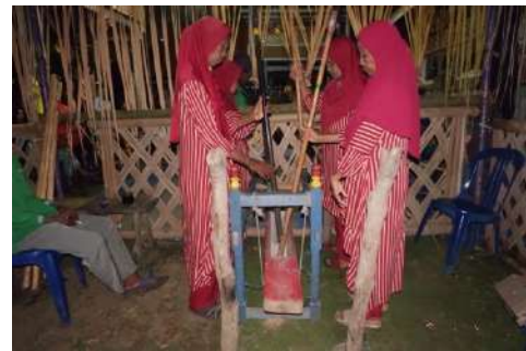
Gambar 1.3 Pakkindo'na (Wanita)