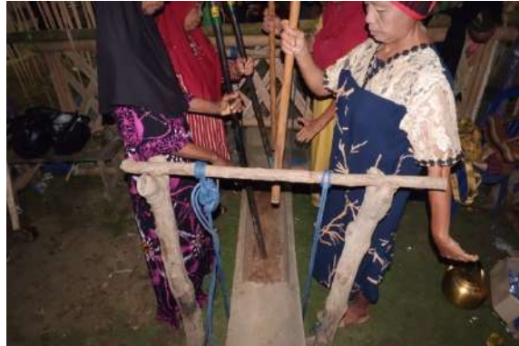
Gambar 1.1 Prosesi Mappadendang Saoraja Baringeng

Prosesi mappadendang di Desa Baringeng, diselenggarakan setiap hampir penghujung tahun. Dalam hal ini dihadiri oleh berbagai kalangan masyarakat, baik penduduk asli di Desa Baringeng maupun yang berasal dari luar daerah. Prosesi mappadendang di Desa Baringeng di pimpin oleh pemimpin adat yang ada disana. Terdiri dari beberapa rangkaian, yang diselenggarakan selama empat hari yang dimulai sejak hari rabu hingga hari sabtu. Prosesi mappadendang di Desa Baringeng, menghadirkan berbagai macam rangkaian dalam empat hari secara terus menerus.