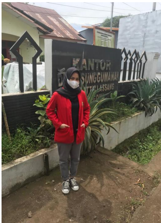
Kantor Desa Sunggumana