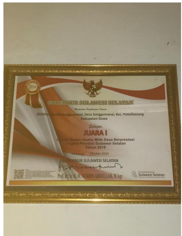
Piagam penghargaan BUMDes