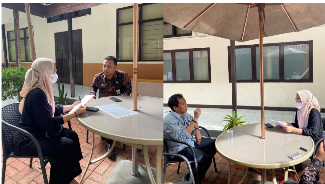
(Dokumentasi Wawancara Dengan Widyaiswara)