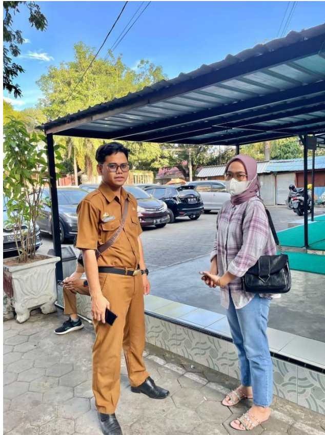
(Dokumentasi Wawancara dengan Peserta Latsar)