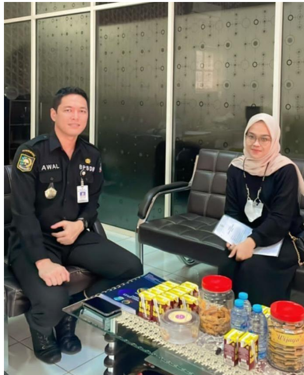
(Dokumentasi Wawancara Kabid Pengembangan Kompetensi Manajerial)