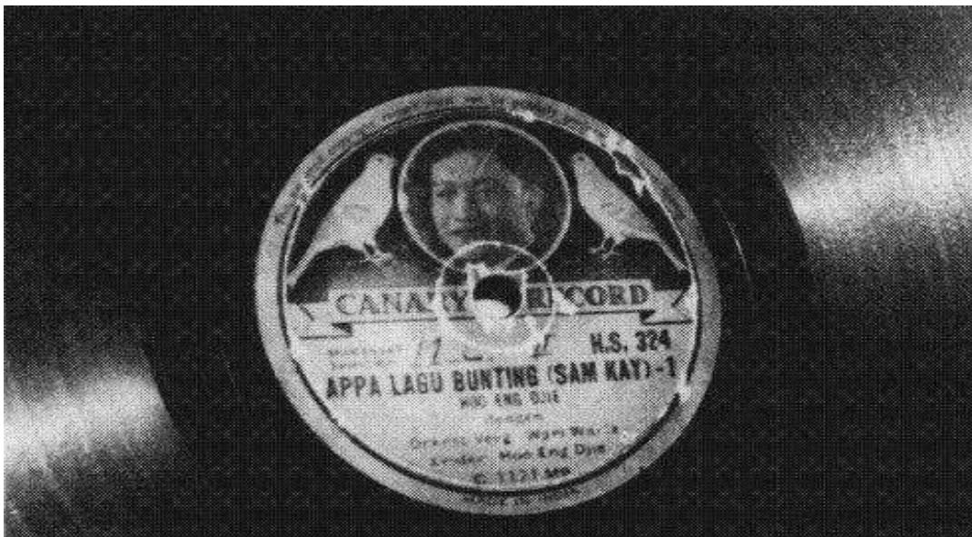
Gambar 2.3 Album Piringan Hitam Appa Lagu Bunting (4 Lagu Pernikahan) oleh Hoe Eng Djie Dirilis Oleh Canary Records.

Pada gambar 2.3 album piringan hitam Appa Lagu Bunting (4 Lagu