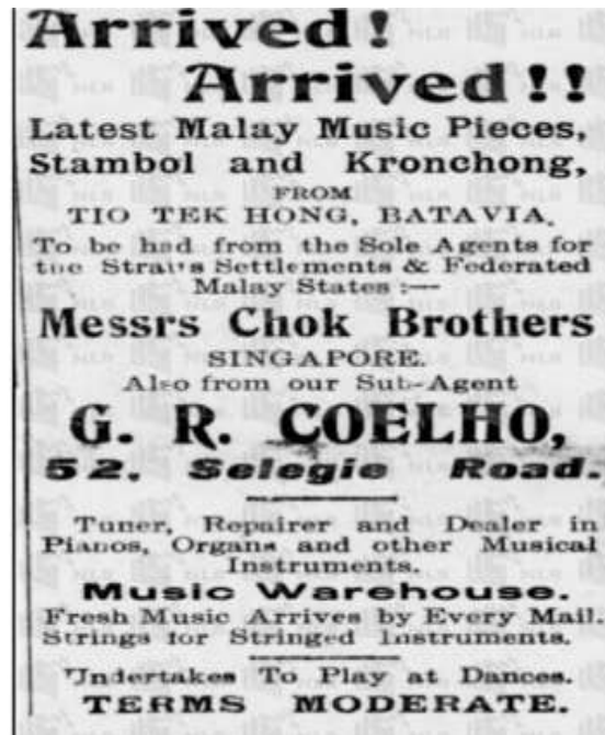
Gambar 2.2 Iklan Tio Tek Hong di Koran Malaya Tribune, Singapura 1915.