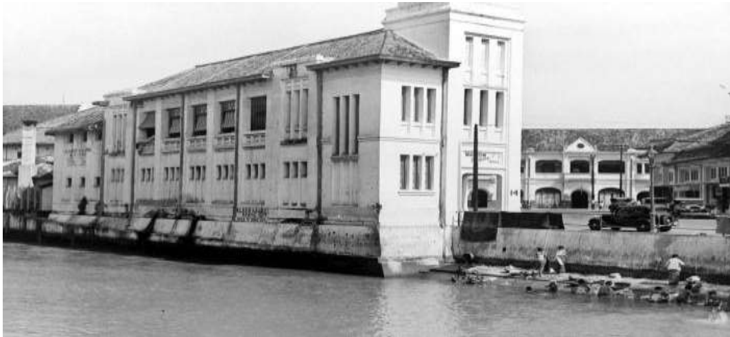
Gambar 2.1 Gedung Tio Tek Hong 1905 di Passer Baroe .

Perkembangan industri musik di Indonesia bermula ketika mesin