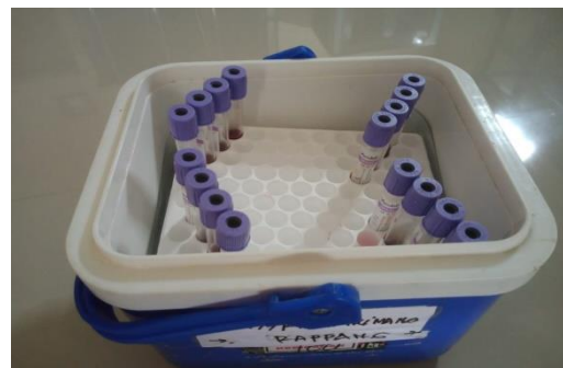
Penyimpanan Sampel Darah pada Cooler Box