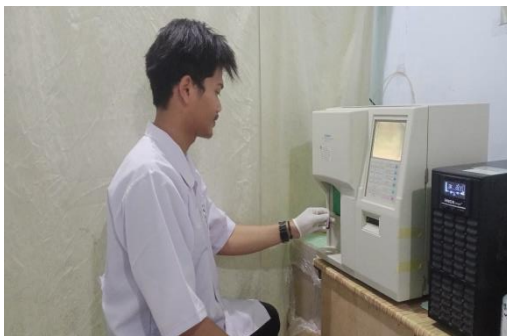
Proses Analisis Darah