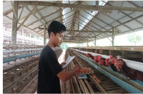
Penimbangan dan Pencatatan Produksi Telur