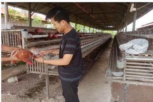
Pengambilan Sampel Darah Ayam