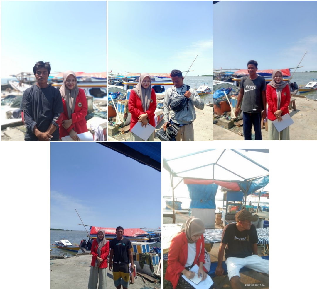
Dokumentasi Pribadi diambil Pada tanggal 19 sampai 25 Juli 2022