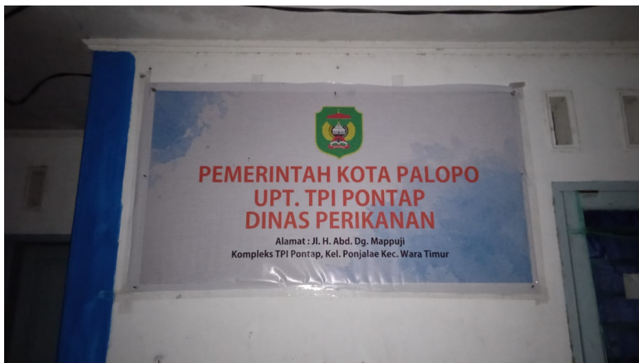
Dokumentasi Pribadi diambil Pada tanggal 26 Juli 2022