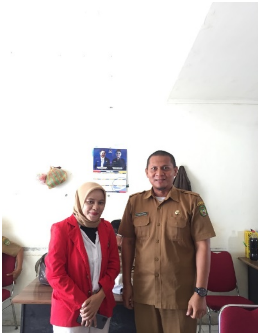
diambil Pada tanggal 19 sampai 25 Juli 2022