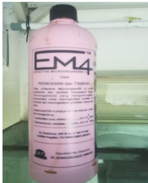
Gambar 2. Probiotik EM4

EM4 mengandung bakteri Lactobacillus casei dan Saccaromyces cerevisiae , EM4 berfungsi sebagai activator dalam fermentasi bahan organik. Seperti kotoran burung puyuh atau kotoran ternak lainnya (Cahyono et al., 2015). Menurut (Jamila dan Tangdilintin 2011 dalam Agustin et al., 2017) Bakteri Lactobacillus sp mampu mengurai karbohidrat serta menghasilkan asam-asam lemak untuk kebutuhan nutrisi.