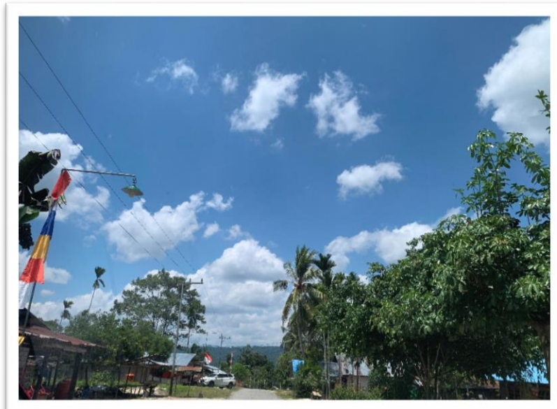
Wilayah Distrik Kemtuk yang terdapat Masyarakat Hukum Adat Klesi Kabupaten Jayapura