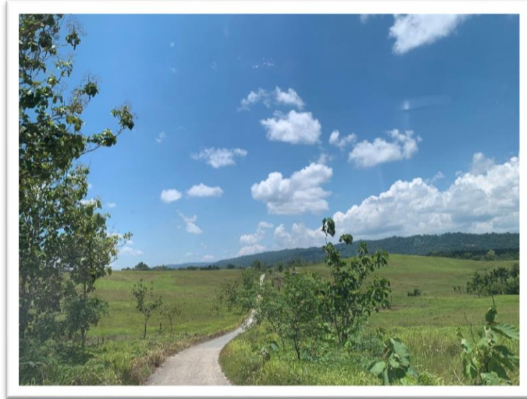
Jalanan menuju Distrik Kemtuk