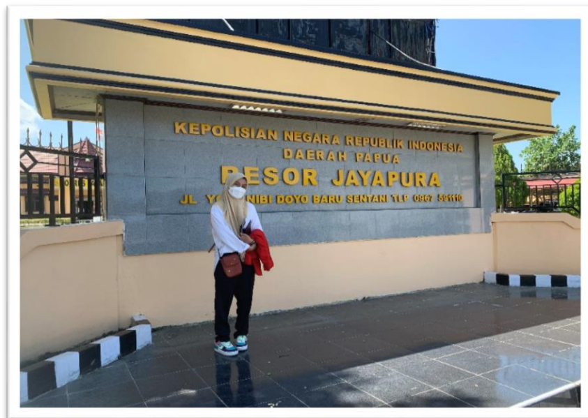
Kepolisian Resor (Polres) Kabupaten Jayapura