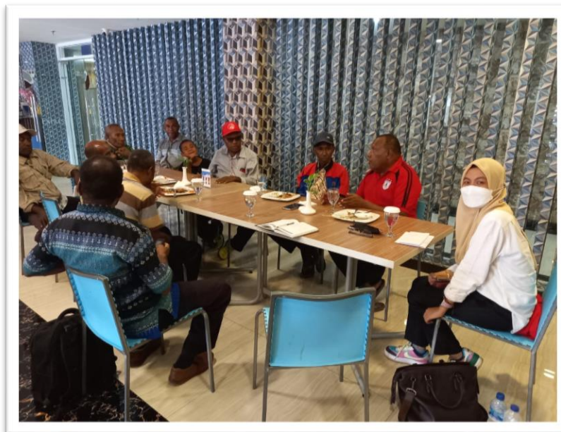
Wawancara bersama Para Pemangku Adat Klesi dan Masyarakat Hukum Adat Klesi di Kabupaten Jayapura