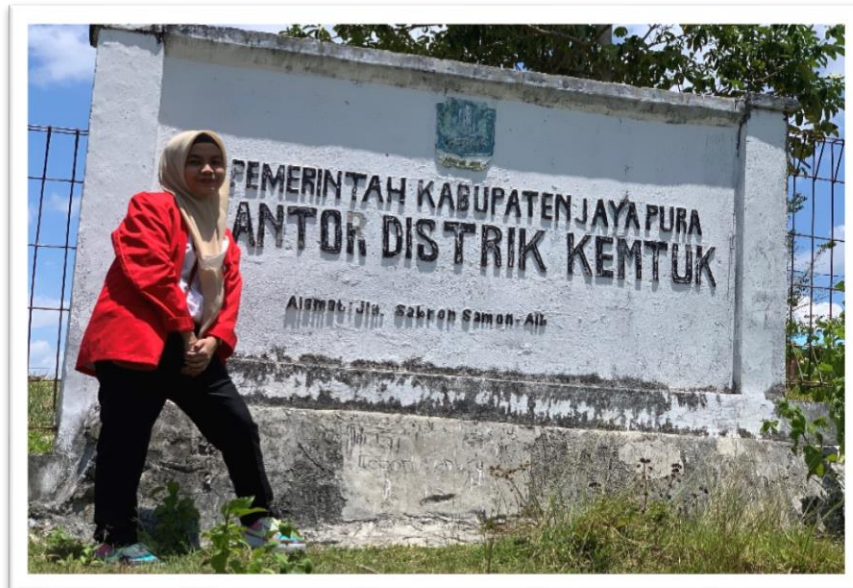
Kantor Distrik Kentuk, Kabupaten Jayapura