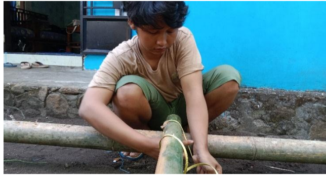
Gambar 5. Pembuatan rangka bambu