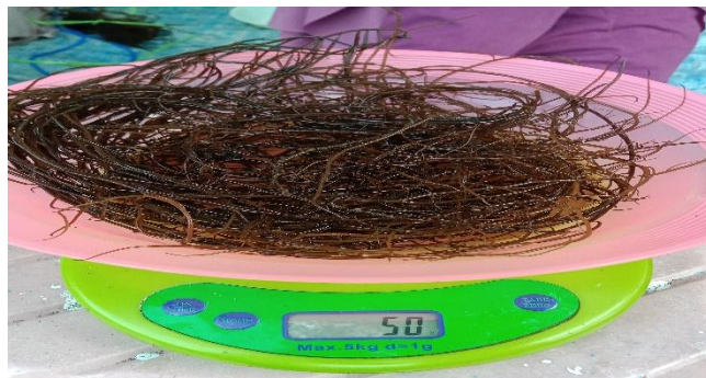
Gambar 7. Penimbangan bibit rumput laut G. changii