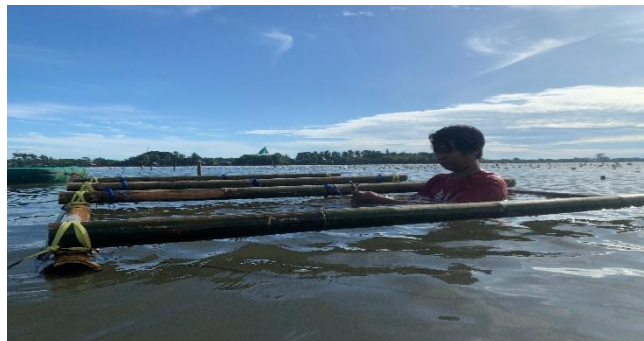
Gambar 8. Pengikatan kantong jaring pada rakit bambu