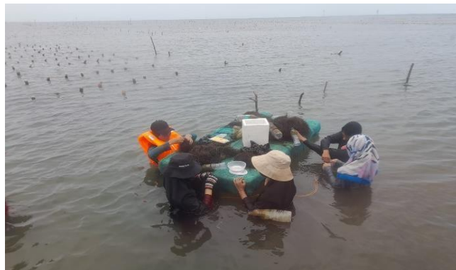
Gambar 11. Pemanenan rumput laut G. changii