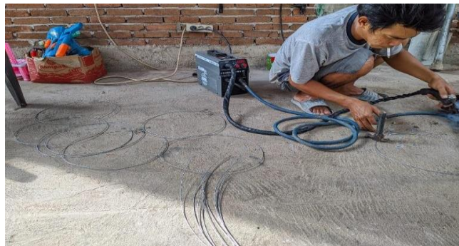
Gambar 6. Pembuatan rangka kantong jaring