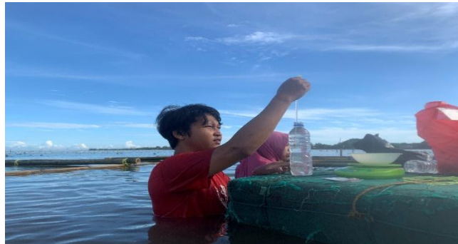
Gambar 10. Pengamatan kualitas air berkala