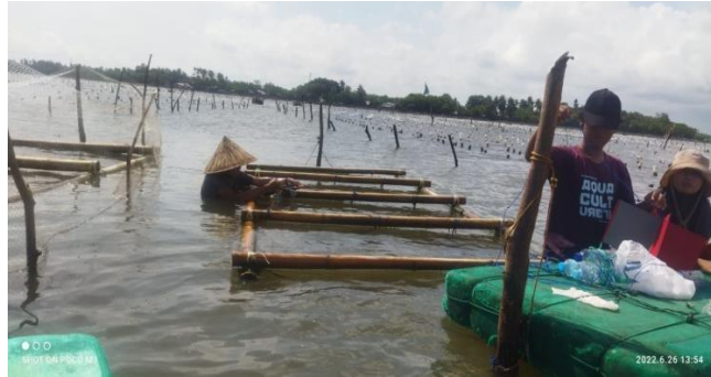
Gambar 9. Pemeliharaan rumput laut