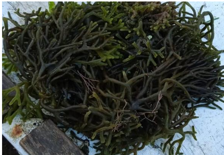
Gambar 3. Thallus Codium fragile yang dikoleksi dari Pasar PPI Beba, memperlihatkan thallus yang bercabang dichotomous.