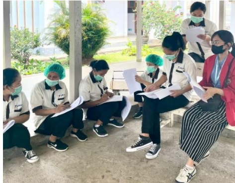
Penjelasan Isi Kuesioner