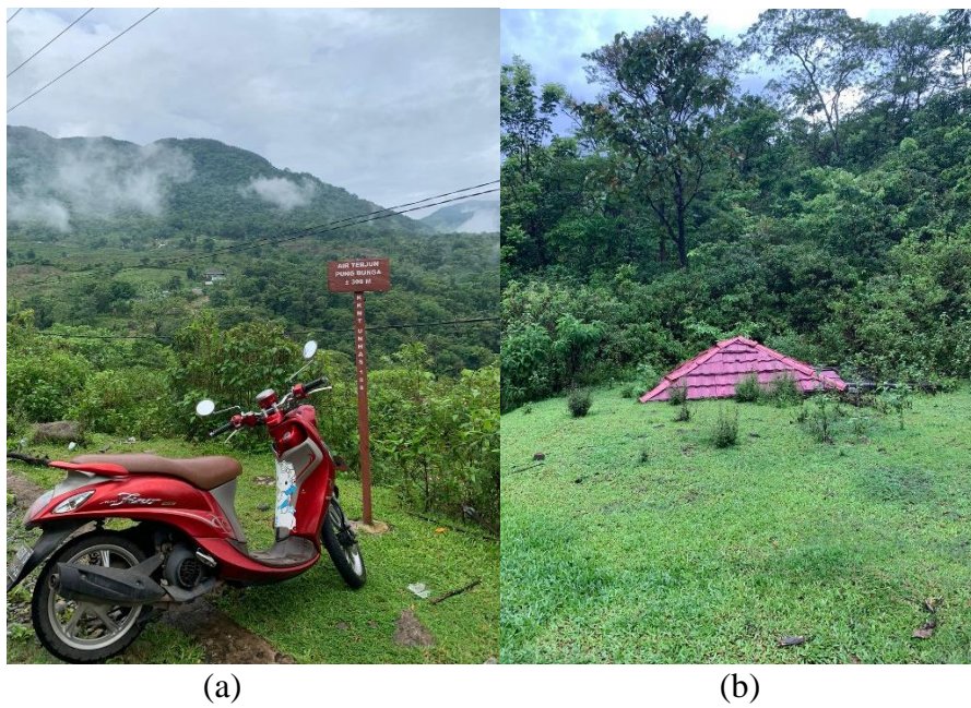
Gambar 2. (a) Lokasi parker, (b) Gazebo yang terbengkalai