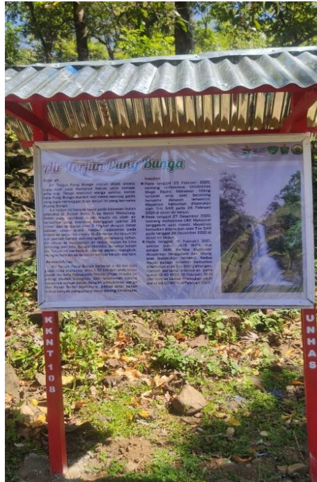
Gambar 3. Papan Informasi