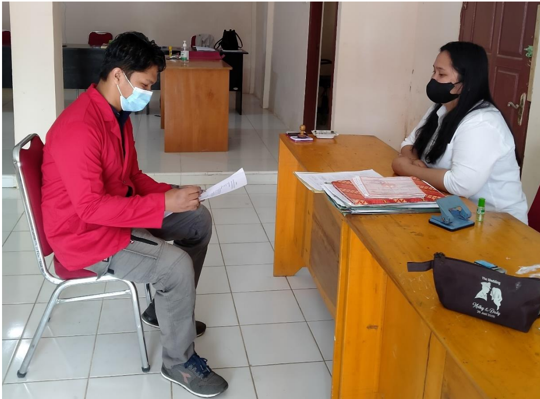
Wawancara dengan Petugas di Kantor Kelurahan Sa'dan Matallo