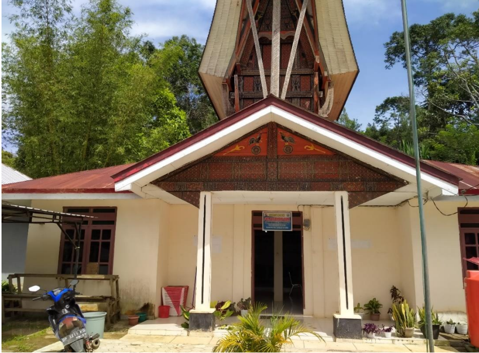
Tempat penelitian kantor lurah Sa'dan Matallo, beralamat Sa'dan andulan, kecamatan Sa'dan, Kabupaten Toraja Utara