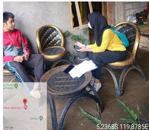
Gambar 6. Wawancara Dengan informan