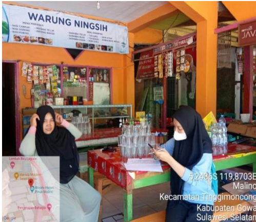
Gambar 3. Wawancara Dengan informan