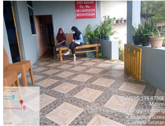
Gambar 4. Wawancara Dengan informan