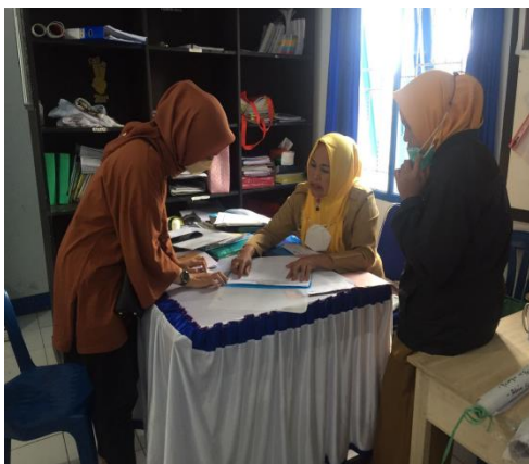
Gambar 7. Kelurahan Malino