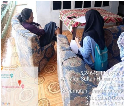
Gambar 5. Wawancara Dengan informan