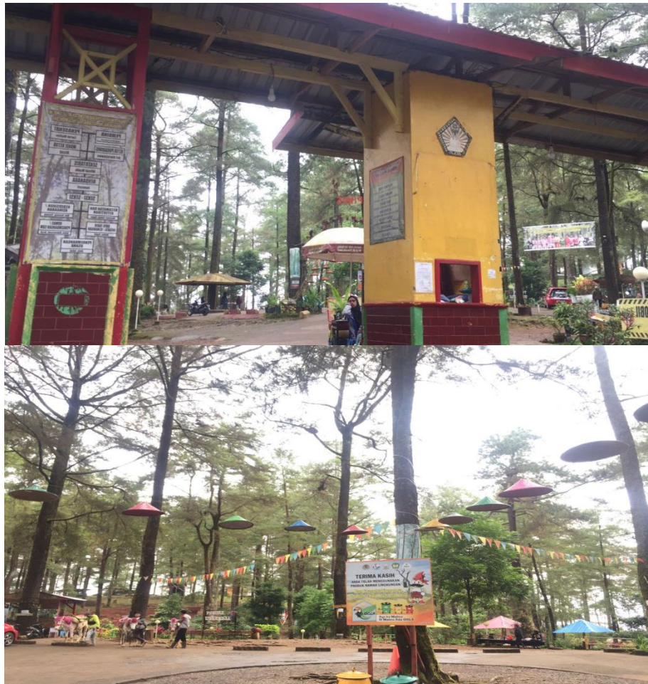
Gambar 1. Wisata Alam Malino