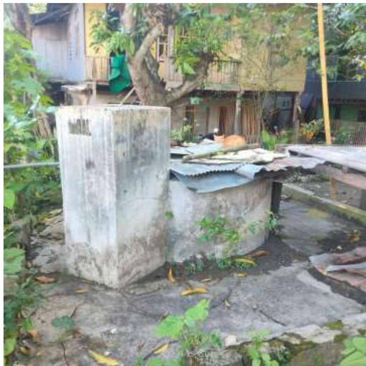
Sumur-sumur di kampung Teppo yang masih digunakan hingga sekarang berlokasi di kampung Teppo Barat, tahun 2022.