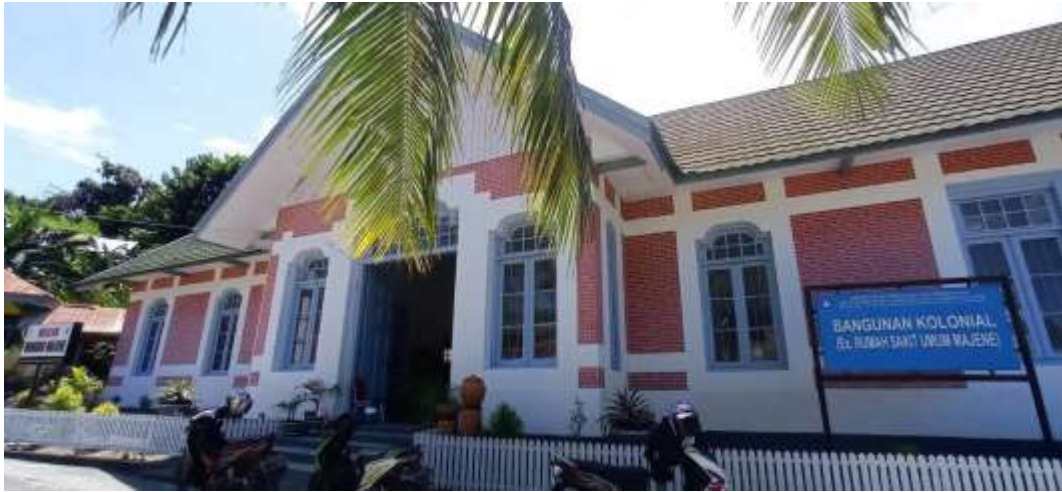
Rumah sakit yang telah beralih fungsi menjadi Museum Mandar.