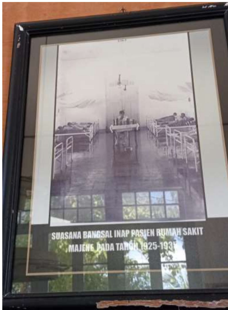
Suasana bangsal inap pasien rumah sakit antara tahun 1925-1934.