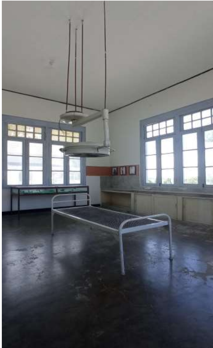
Ruang operasi di salah satu ruangan bangunan rumah sakit.