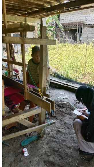
Gambar 2. Wawancara dengan responden