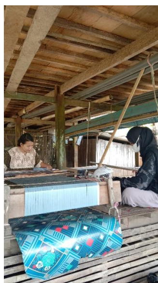
Gambar 4. Wawancara dengan responden