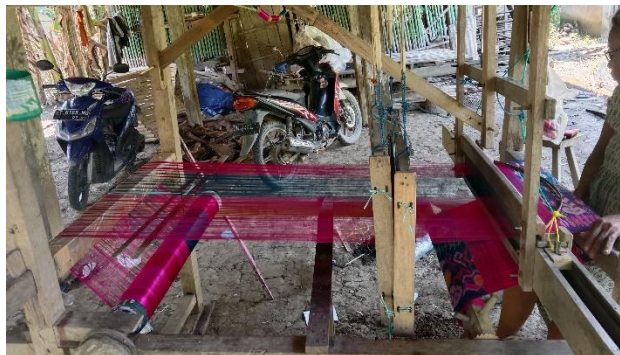
Gambar 6. Alat Tenun Bukan Mesin (ATBM)