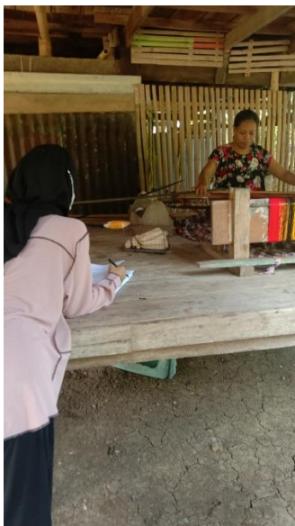
Gambar 3. Wawancara dengan responden