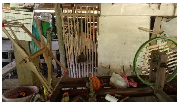
Gambar 7. Jencara, alat untuk membuat kluntungan benang