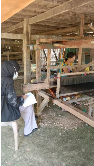
Gambar 1. Wawancara dengan responden