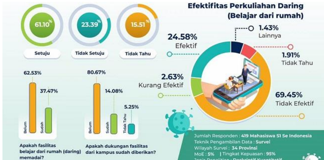
Gambar 1. Efektifitas perkuliahan daring