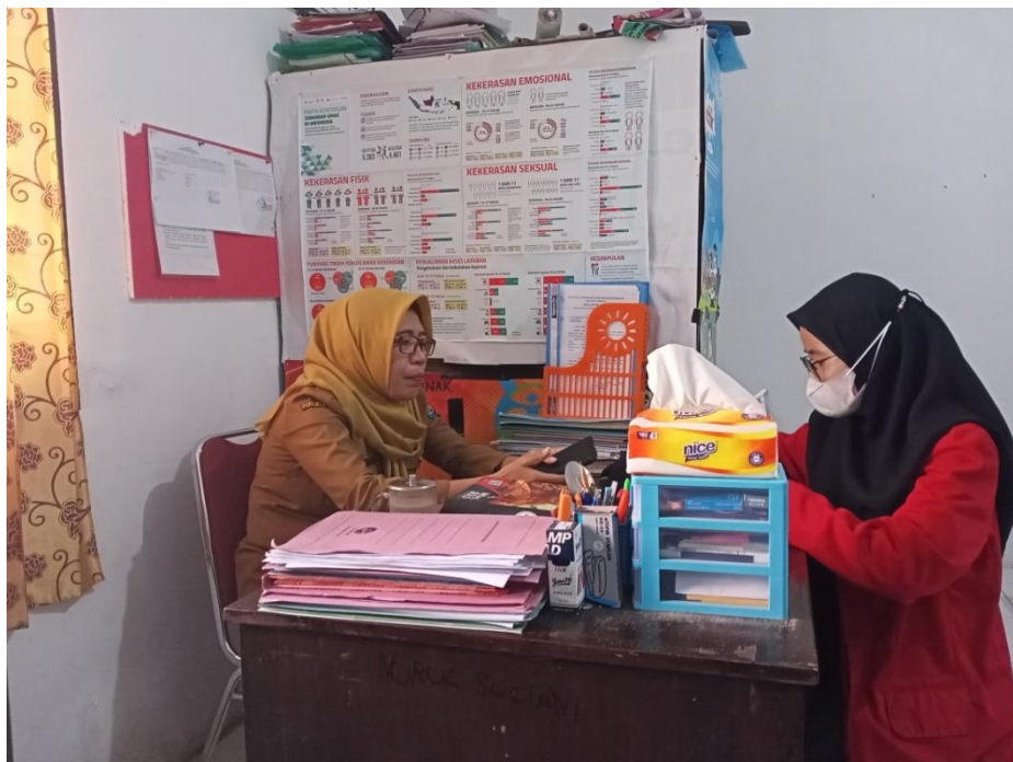
Wawancara dengan Kepala Sub Bidang (KASUBID) Pelayanan Terpadu Perlindungan Perempuan dan Anak Dinas Pemberdayaan Perempuan Dan Perlindungan Anak Kabupaten Gowa, tanggal 23 Juni 2022.