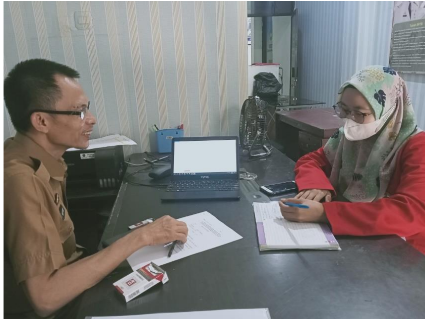
Wawancara dengan Kepala Seksi (Kasi) Pendataan SD Dinas Pendidikan Kabupaten Gowa, tanggal 20 Juni 2022.