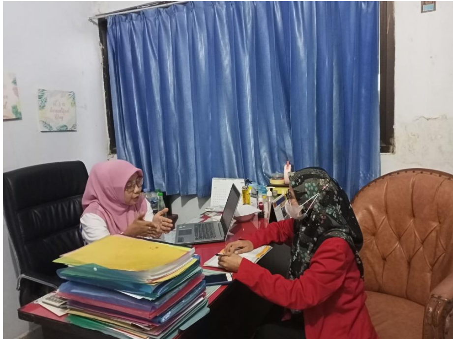
Wawancara dengan Kepala Sub Bagian (Kasubag) Perencanaan dan Pelaporan Dinas Pendidikan Kabupaten Gowa, tanggal 22 Juni 2022.