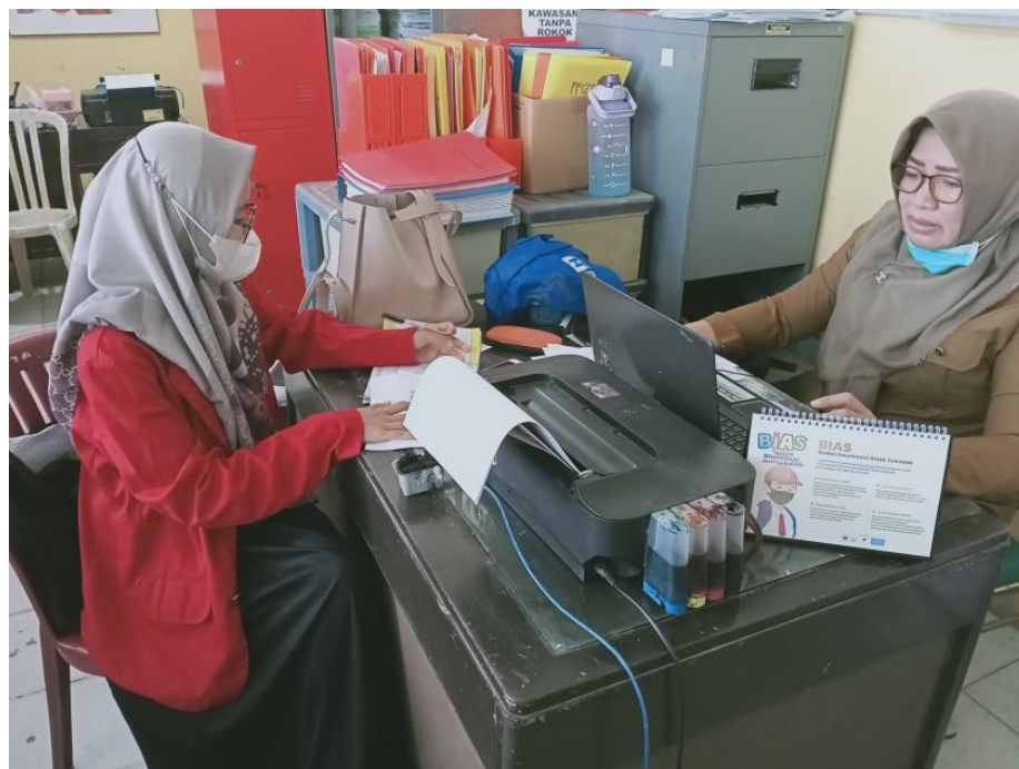
Wawancara dengan Staf Seksi pencegahan dan Pengendalian Penyakit Tidak Menular dan Kesehatan Jiwa (Ptm dan Keswa) Dinas Kesehatan Kabupaten Gowa, tanggal 21 Juni 2022.