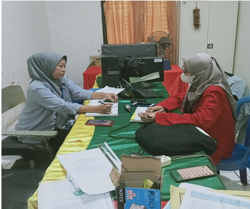
Wawancara dengan Pendamping Rehabilitasi Sosial (PRS) atau Sakti Peksos Satuan Bakti Pekerja Sosial Dinas Sosial Kabupaten Gowa, tanggal 21 Juni 2022.