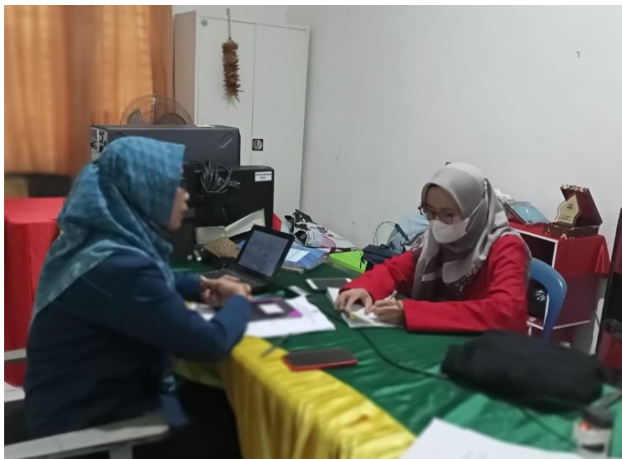
Wawancara dengan Pendamping Rehabilitasi Sosial (PRS) atau Sakti Peksos Satuan Bakti Pekerja Sosial Dinas Sosial Kabupaten Gowa, tanggal 21 Juni 2022.