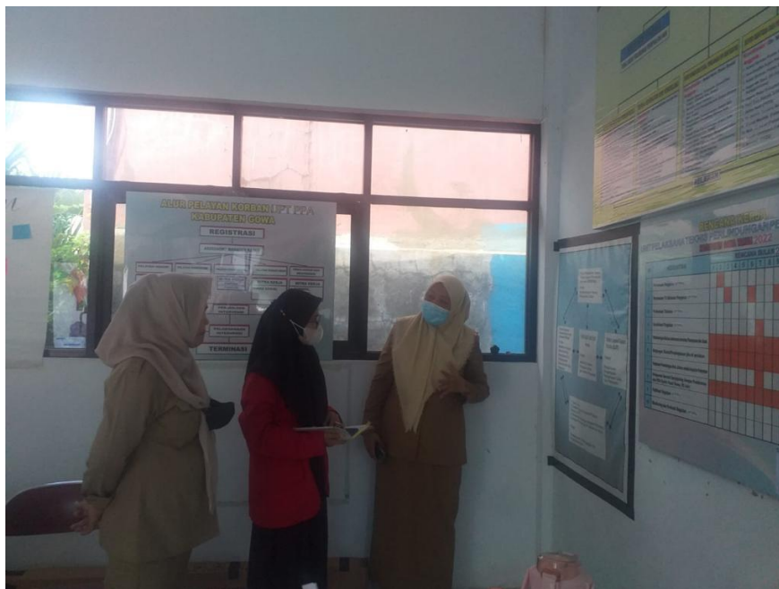
Pemaparan mekanisme PKSAI Sikamaseang di Kabupaten Gowa oleh Tim Pelaksana PKSAI