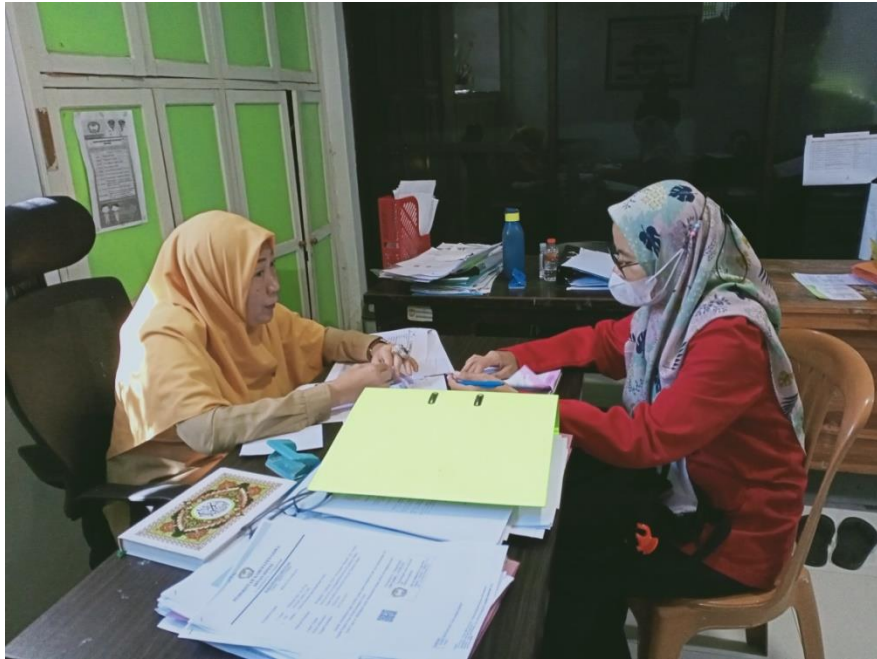
Wawancara dengan Kepala Bidang Pelayanan Rehabilitas Sosial (PRS) Dinas Sosial Kabupaten Gowa, tanggal 20 Juni 2022.