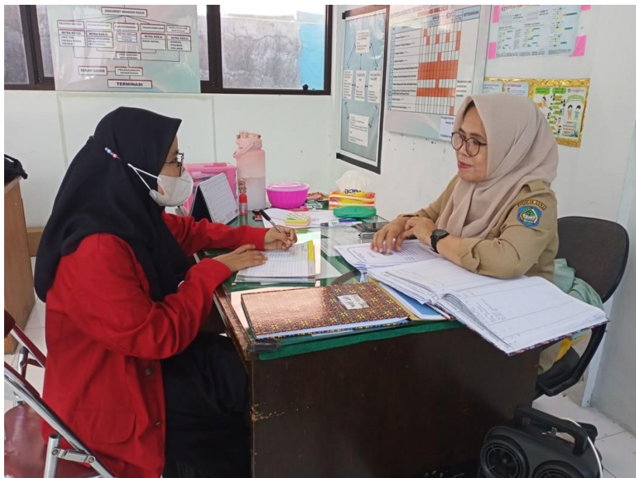
Wawancara dengan Kepala Sub Bidang (KASUBID) Pemenuhan Hak, Perlindungan Khusus Anak Dinas Pemberdayaan Perempuan dan Perlindungan Anak Kabupaten Gowa, tanggal 23 Juni 2022.