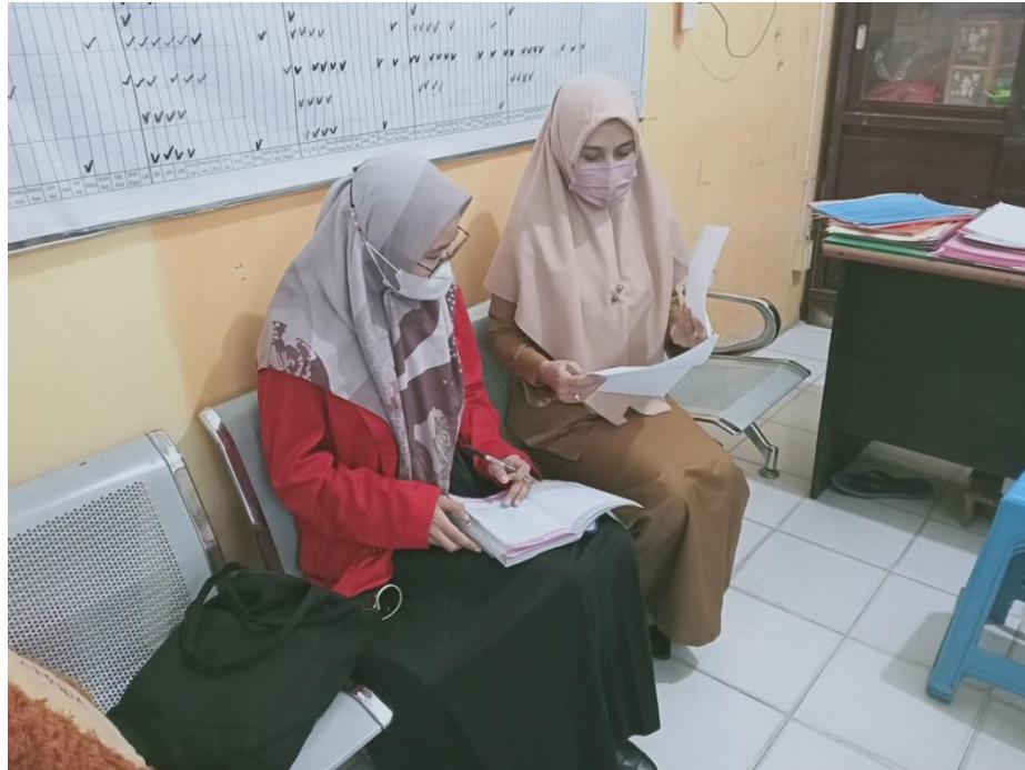
Wawancara dengan Pejabat Fungsional Tertentu Dinas Kesehatan Kabupaten Gowa, tanggal 21 Juni 2022.