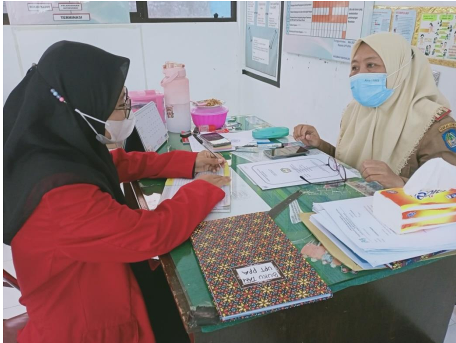
Wawancara dengan Kepala Dinas Pemberdayaan Perempuan dan Perlindungan Anak Kabupaten Gowa, tanggal 23 Juni 2022.