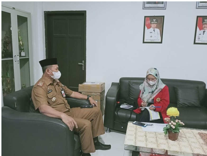
Wawancara dengan Kepala Dinas Sosial Kabupaten Gowa, tanggal 20 Juni 2022.