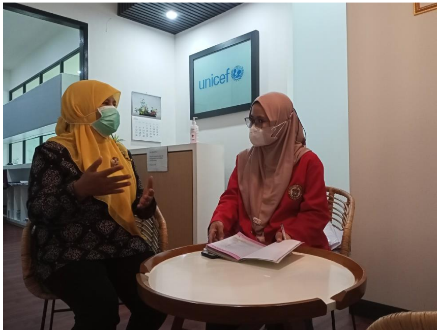
Wawancara dengan Child Protection Specialist at United Nations Children's Fund (Unicef), tanggal 30 Juni 2022.