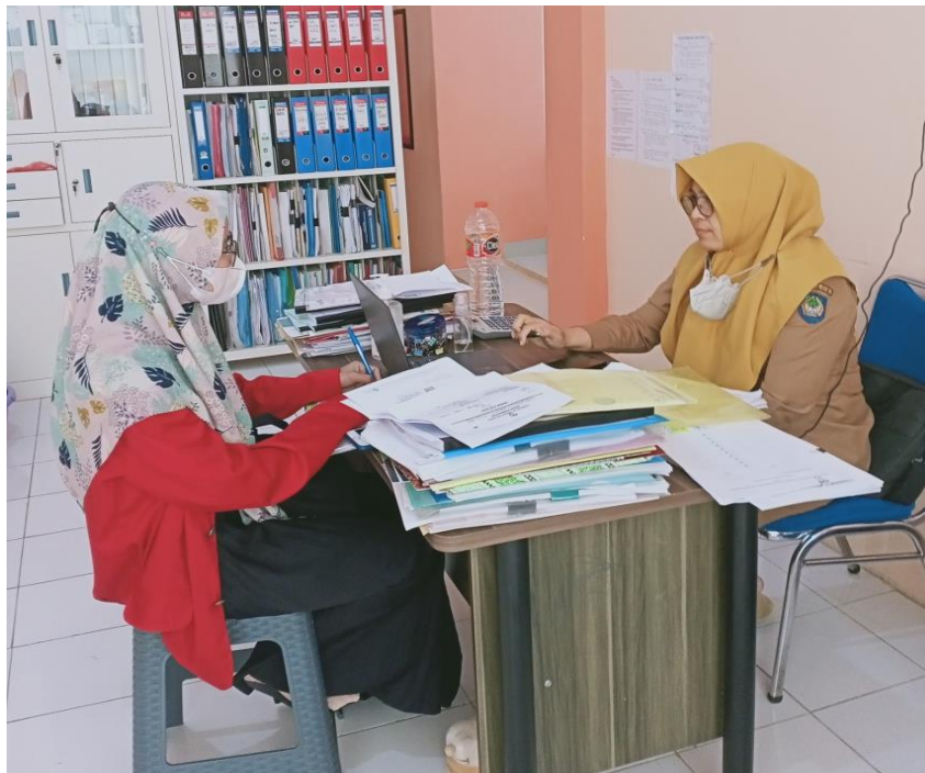
Wawancara dengan Kepala Sub Bagian (Kasubag) Perencanaan Dinas Kesehatan Kabupaten Gowa, tanggal 20 Juni 2022.