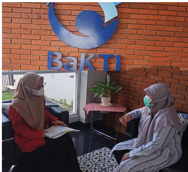
Wawancara dengan Technical Assistance for Program Child Protection Expert Strengthening Safe and Friendly Environment for Children (SAFE4C) pada Program UNICEF-BaKTI, tanggal 27 Juni 2022.