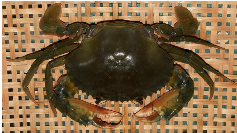
Gambar 1. Kepiting Bakau ( Scylla olivacea )

Kepiting bakau, Scylla olivacea dapat hidup di ekosistem yang berbeda. Sebagian besar siklus hidupnya berada di perairan tepi pantai termasuk muara atau estuaria, perairan bakau dan sebagian kecil di lautan untuk memijah. Distribusi kepiting menurut kedalaman air hanya terbatas pada daerah litoral dengan kisaran kedalaman 0-32 meter dan sebagian kecil hidup di laut dalam. Kepiting bakau jantan umumnya hidup di perairan ekosistem mangrove. Alasannya, perairan ini memiliki persediaan makanan yang lebih banyak dibandingkan perairan laut terbuka (Adha, 2015). Morfologi kepiting bakau, S. olivacea dapat dilihat pada Gambar 1.