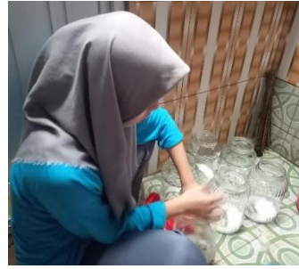
Pembersihan peralatan penelitian