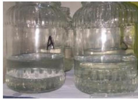
Uji stres pelaparan