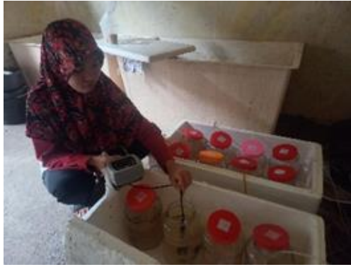
Pengukuran suhu dan DO