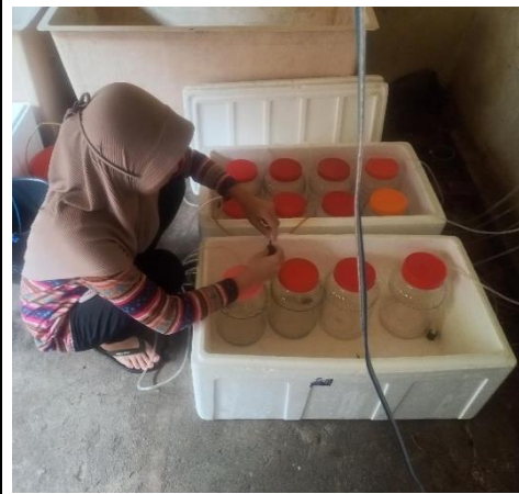
Pemasangan peralatan aerasi