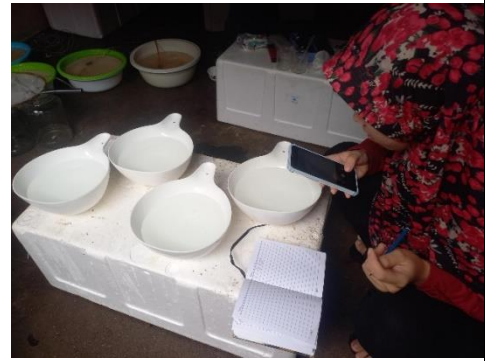
Pengamatan tingkah laku larva