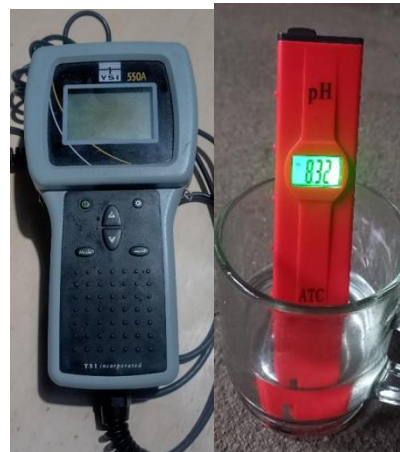
DO meter dan pH meter