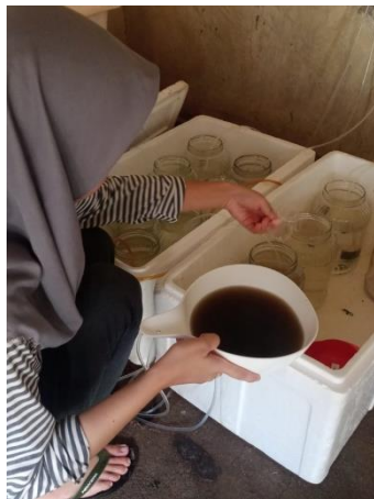
Pemberian pakan alami