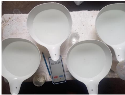
Penghitungan jumlah larva yang mati