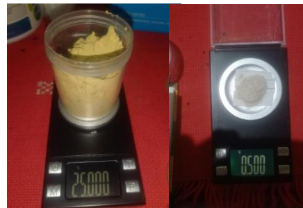
Penimbangan pakan dan probiotik