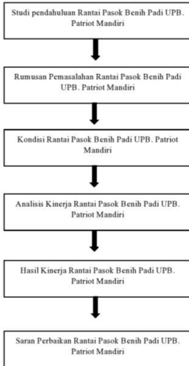
Gambar 2. Kerangka Pemikiran Penelitian