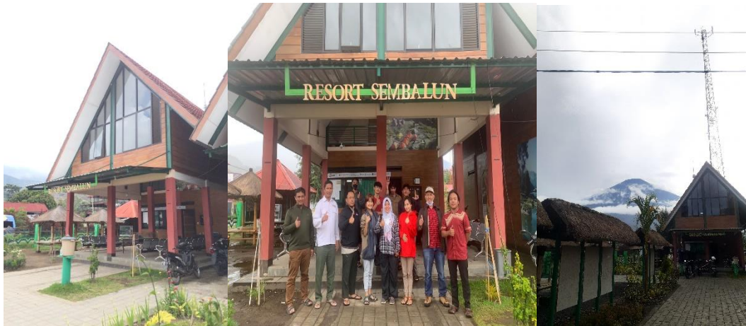
Observasi lapangan Resort Sembalun