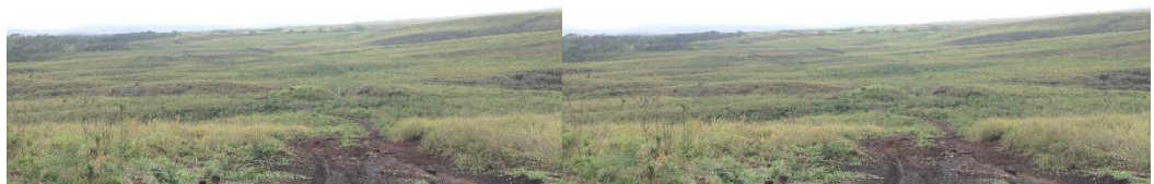
Pemandangan alam jalur pendakian