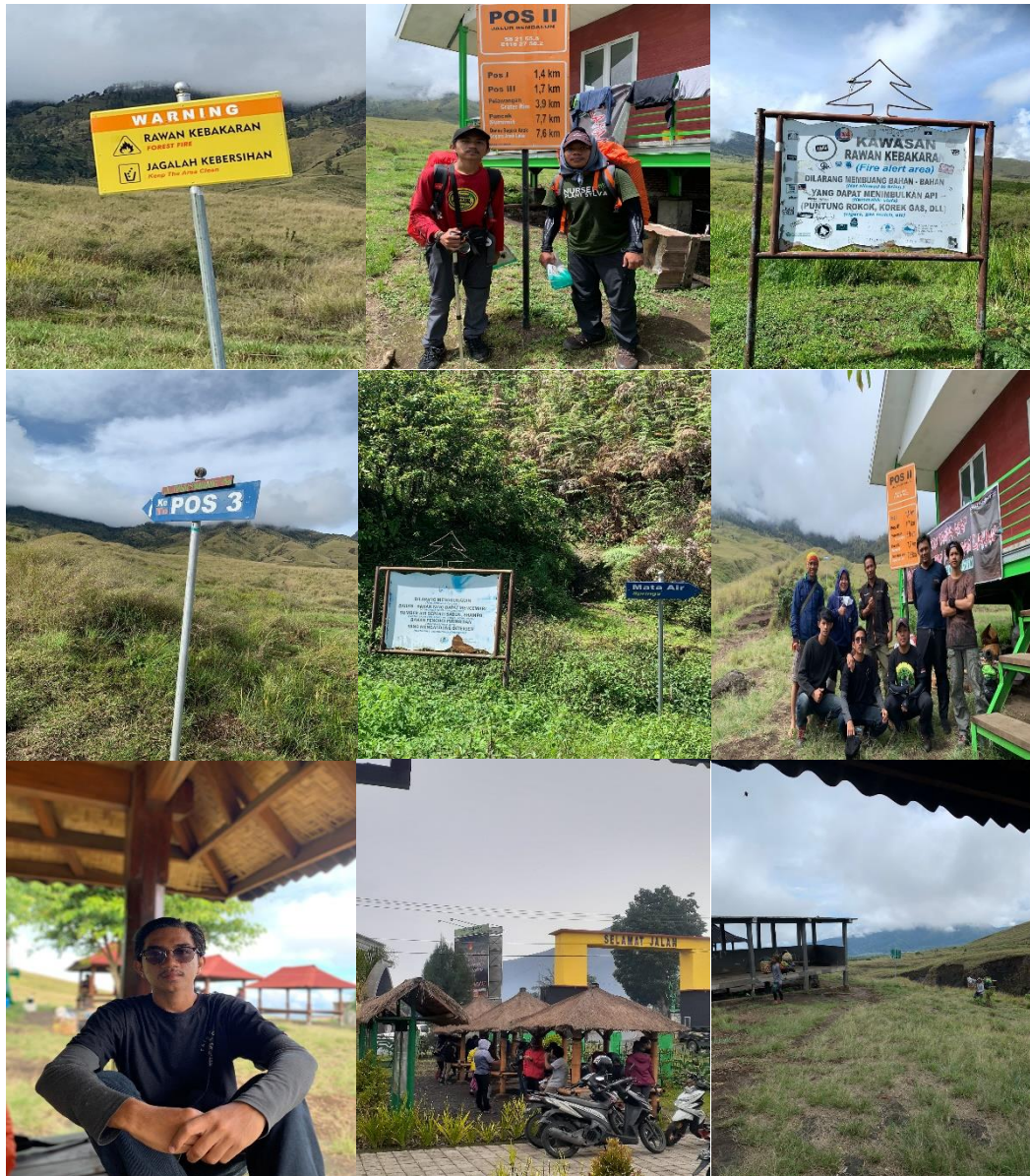
Ketersediaan dan kondisi fasilitas penunjang kegiatan wisata alam pendakian Gunung Rinjani jalur Sembalun