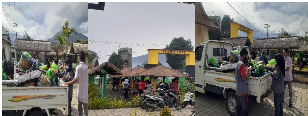
Proses pelayanan petugas TNGR kepada para wisatawan